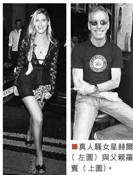
真人騷女星赫爾(左圖)與父親羅賓(上圖)。

英國電視真人騷女星赫爾上周傳出其父親於香港上吊自殺，赫爾有份參演《切爾西製造》真人騷，節目描述一眾上流社會女性的奢華生活，但是次爆出家庭悲劇，完全粉碎熒幕前的夢幻假象，令人看出華麗背後的困境。