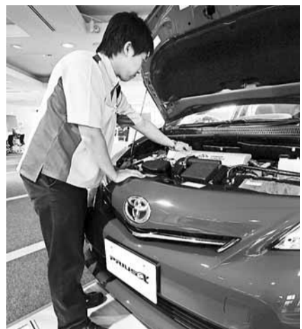
豐田強迫車行不得為沒有投訴的車主在保用期內主動維修。圖為日本豐田陳列室的職員檢查車輛。資料圖片