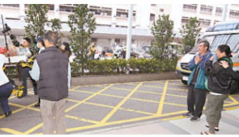
老婦遭小巴撞至命危，陪同送院的家人合什祈禱。

據悉，老婦兒孫滿堂，子女均另有家庭，但不時會相約母親茶敘享天倫。早前，家人又趁假日再相約到荃灣區酒樓品茗及團聚。事發於昨日下午3時許，老婦相約家人在荃華街悅來酒店對開會合，現場消息稱，老婦抵酒店對面馬路，已見一眾家人抵達等候，即心急趕過馬路會合，豈料橫過馬路時，一輛專線小巴駛至，家人雖馬上喝止，惜為時已晚，老婦仍被小巴車頭撞中，當場飛彈至數米之外墮地，重傷昏迷。家人目睹老人出