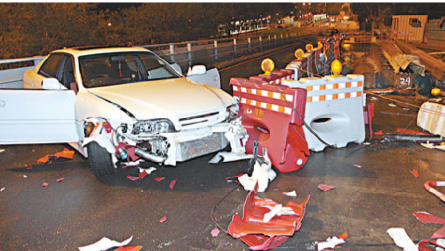
瘋狂駕駛案中肇事私家車狂撼路邊水馬，車頭毀爛不堪。