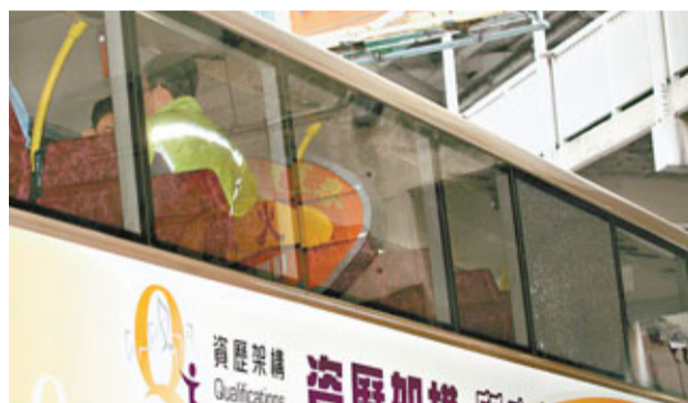
警員於肇事巴士上層調查打毀車窗玻璃事件。

警員接報趕至，經調查後將該名男子拘捕，惟男子被帶署時，突向警員表示患精神病已多年，又大叫大嚷，聲稱坐車時感到不安，解釋：「架車開得咁快，我驚佢翻車，先打爛塊玻璃窗，以便意外發生時可以即時逃生呀！」令人啼笑皆非。