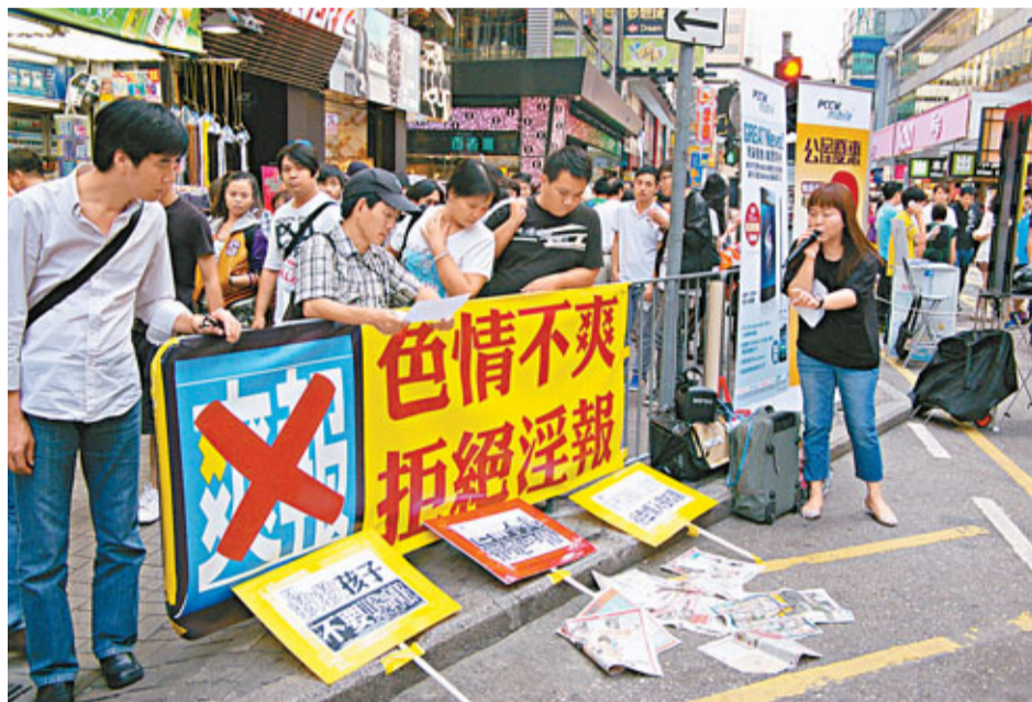
壹傳媒集團在香港推出免費報紙《爽報》，內容被指渲染淫褻、暴力等，毒害青少年心智。資料圖片

由於該報是免費派發，兒童及青少年可輕易取閱，及接觸當中的色情及淫褻的內容，對成長造成不良影響。是次事件觸發多個教育及婦女團體到壹傳媒集團的總部抗議，狠批集團是「淫報」，只顧賺錢，罔顧社會責任及下一代的心智健康。