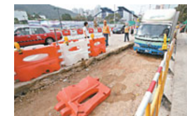
密斗貨車失控衝入路邊地盤停下。香港文匯報記者 劉友光 攝

香港文匯報訊(記者 杜法祖)一輛密斗貨車昨晨8時許沿香港仔警校道斜行駛，中途轉入海洋公園道時，突然失控衝向路中一個修路地盤，貨車先撞毀地盤外一列10米長「水馬」，繼而衝入地盤，跌進地盤一條約半米深的坑道內停下，車身損毀輕微，中年貨車司機扭傷頸部留在車廂內，跟車工人沒有受傷，致電報警求助，消防員到場將司機救出，交由救護員送醫院治理，警員在現場調查意外成因。