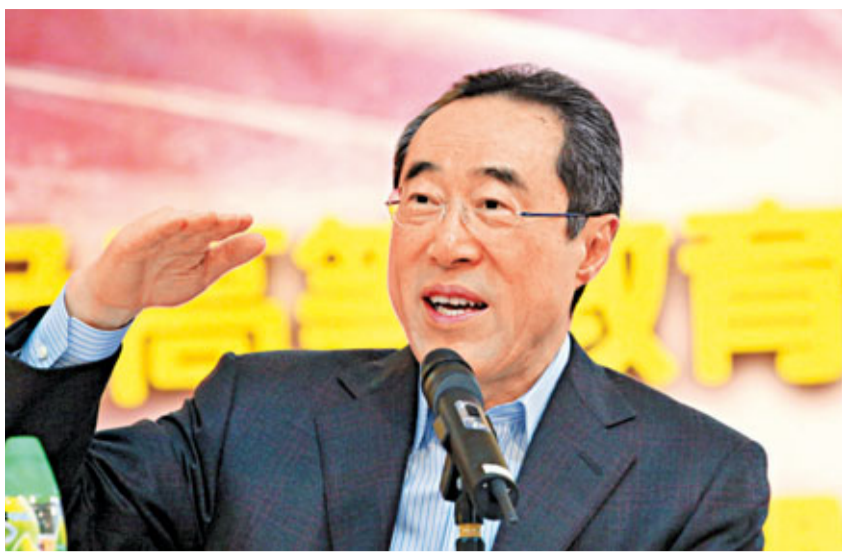
唐英年出席教育界及高等教育界舉行的論壇。

香港文匯報訊(記者 鄭治祖)教育質素是香港未來發展的重要關鍵。特首參選人唐英年強調,香港有必要增加教育資源,應最少佔本地生產總值(GDP)的4%,尤其是在師資方面,如加快4幅用作興建私立大學的土地審批程序;增加大學宿位,吸引更多海外學生來港就讀;為吸引有成就的學者來港工作,增加國際學校,以配合其子女教育的需要等,希望香港成為亞洲教育樞紐,以吸納海外人才。