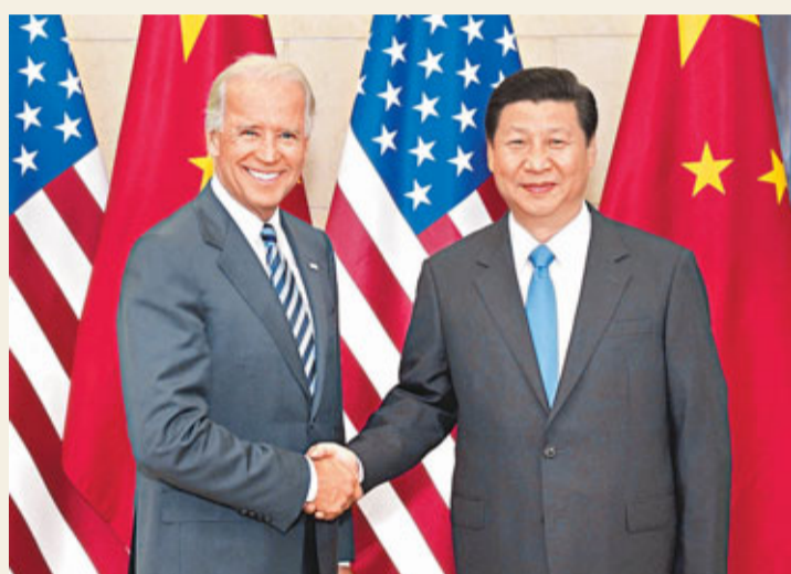
應美國副總統拜登的邀請，習近平將於2月14日訪問美國，期間極可能到訪他27年前曾造訪過的愛荷華州小鎮馬斯卡廷。

香港文匯報訊（記者 海巖 北京報道）中國國家副主席習近平下周將訪問美國，期間，他極有可能到27年前曾造訪過的美國中西部愛荷華州的小鎮馬斯卡廷（Muscatine），與當年會晤過的老朋友晤面、茶敘。據當地華文媒體報道，當馬斯卡廷居民得知習近平將故地重遊的消息後，都期待這位中國貴客再次光臨。