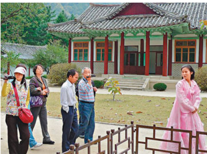
中朝將共同開發朝鮮羅先經貿區，在交通設施、資源開發、跨境旅遊等方面展開合作。圖為中國遊客在朝鮮羅先觀光。

根據規劃，中朝羅先經貿區總面積470平方公里，以基礎設施、產業園區、物流網絡、旅遊合作開發和建設為重點，發展原材料工業、裝備工業、高新技術、輕工業、服務業、現代高效農業等六大產業。目標是建成朝鮮先進製造業基地、東北亞地區國際物流中心和區域性旅遊中心。