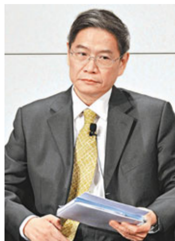
對於「中國會出現阿拉伯之春」之說，張志軍強調是幻想。

張志軍就「阿拉伯之春」問題回應說，中國同西亞北非地區國家實行的政策不同，具體情況也不一樣。事實上，根據西方機構的一項民意調查，在民眾對政府滿意度方面，中國政府以超過70%的得票率高居第一。中國政府之所以受到民眾的擁護，理由很簡單，改革開放三十多年來，中國政治、經濟、社會等方面迅速發展，其成就超過了歷史上任何階段。任何人只要看看這些變化，就知道所謂「中國出現阿拉伯之春」是幻想。