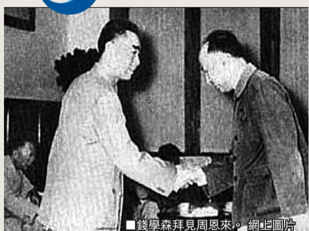
錢學森拜見周恩來。

錢學森：沒有總理保護 我早不在人世 我國搞原子彈、氫彈、導彈、人造衛星，都是周總理領導的。一次我跟駐京外國記者談話，我就說我們這些科技人員都很懷念周總理。「文革」期間，周總理仍然抓住這項工作不放，別的工作亂了，做不了啦，但「兩彈」的工作一直沒停。 我感受最深的是總理確實肯花時間認真聽我們的意見。這是總理一貫的作風。每次開會來的人很多，不同意見的人也請來，總理反覆問：「有什麼意見沒有？」聽了我們的意見，他最後決定怎麼辦。