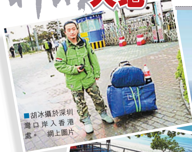
胡冰攝於深圳灣口岸入香港處。網上圖片