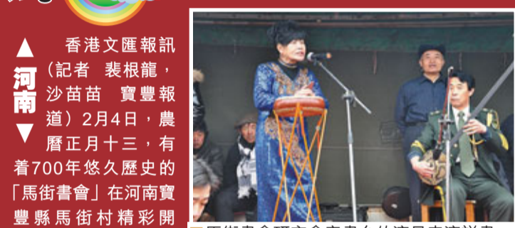
馬街書會研究會亮書台的演員表演說書。

香港文匯報訊（記者 裴根龍，沙苗苗 寶豐報導）2月4日，農曆正月十三，有着700年悠久歷史的「馬街書會」在河南寶豐縣馬街村精彩開鑼。上千名說唱藝人負鼓攜琴，從四面八方匯聚馬街，上百畝麥田變身舞台，趕會聽書的民眾達數十萬人。 河南省寶豐縣被譽為「中國曲藝之鄉」和「中國魔術之鄉」。據了解，馬街位於河南省寶豐縣城南7公里處，馬街書會規模宏大，歷史上曾多次記載，清初的