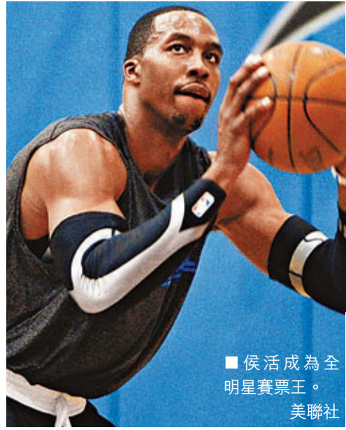
侯活成為全明星賽票王。