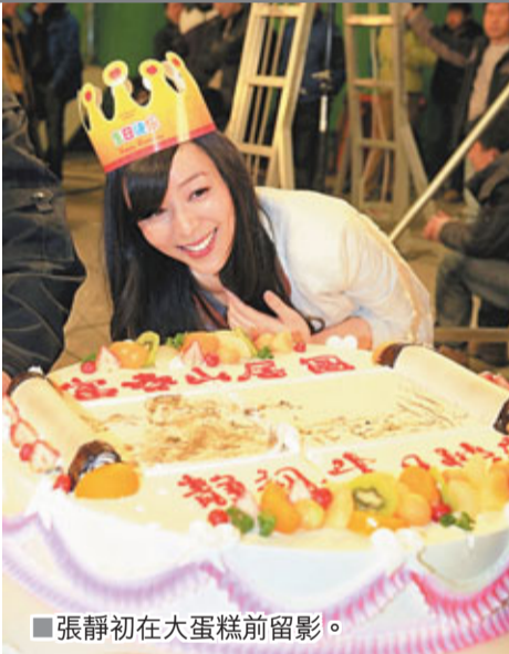
張靜初在大蛋糕前留影。

張靜初拍攝《富春山居圖》的過程其實相當辛苦，當中有一場戲為了達到最佳效果，張靜初被要求在4℃-5℃的湖水中泡過近半個小時，及在製作頭模道具時進行了多個小時的「石化」，張靜初對此都毫無半句怨言，她的敬業精神獲劇組人員力讚。張靜初亦會在片中挑戰動作極限，與劉德華演繹中國版的「史密斯夫婦」。據悉，《富春山居圖》在結束了杭州及迪拜的拍攝後，將到北京繼續進行拍攝。