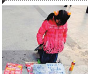
「學生妹」低著頭乞討，地下的自述稱無錢上學。