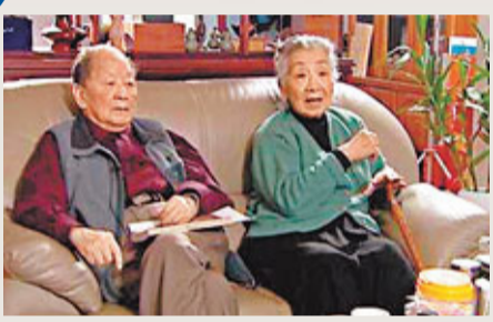
黃苗子、郁風夫婦。

苗子兄也有很多很多好笑的。他的出生、學識、經歷，自小都浮在文化和政治的上層（東北勞改四年半除外），說來說去可算是一種特殊的「純潔」。我和他不一樣，自小就沒有受過嚴格端正的教育，靠自己哺育自己，體會另外半個世界的機會比他豐富。他清楚這一點，正如孔夫子說過的：「吾生也賤，故多能鄙事。」