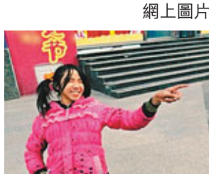
「學生妹」抬起頭，嚇倒一片路人。