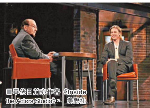
畢佬日前亦作客《Inside the Actors Studio》。

美國時間2月1日，荷里活男星畢彼特(Brad Pitt)與《魔球》中的拍檔Jonah Hill齊作客節目《Today》，接受主持人Ann Curry的訪問，其間談到合作一事，Jonah還大拍畢佬馬屁，令畢佬不時露笑容。