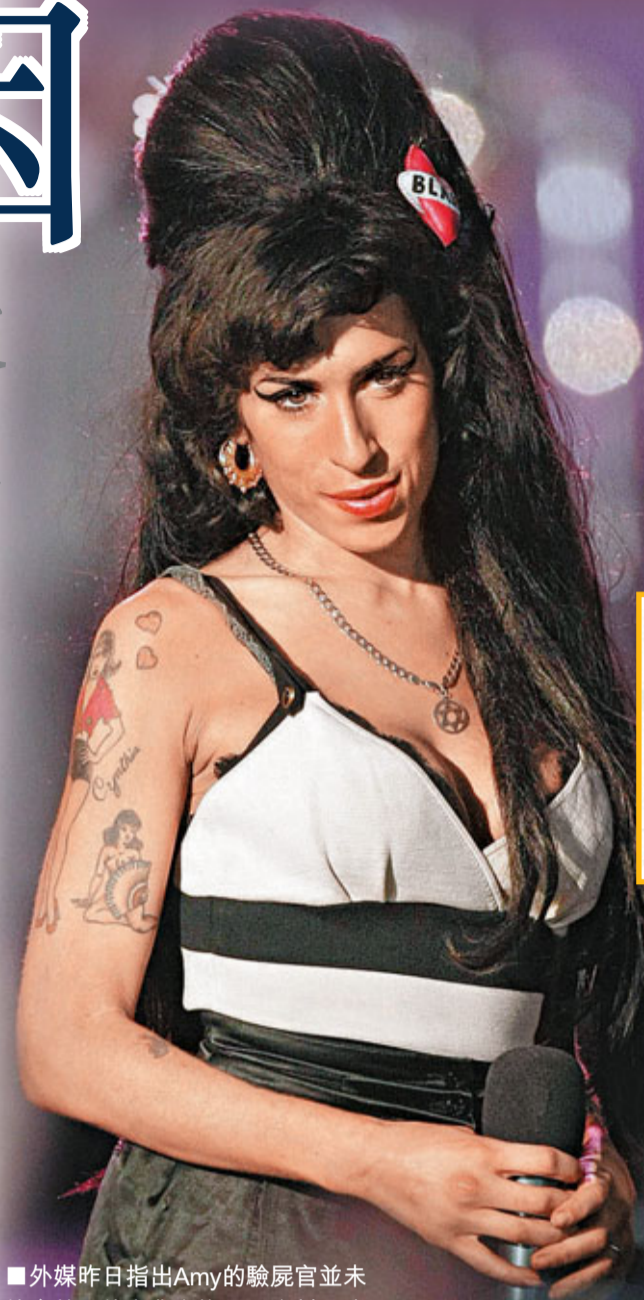
外媒昨日指出Amy的驗屍官並未符合英國的專業資格。資料圖片