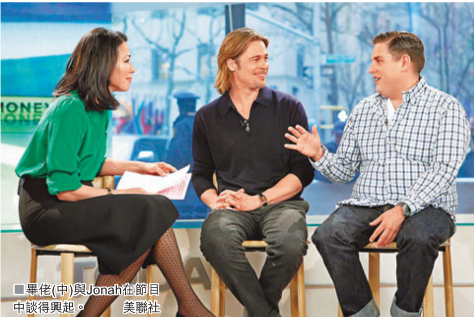
畢佬(中)與Jonah在節目中談得興起。