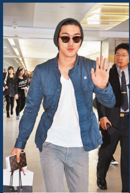
始源在機場向大家揮手。