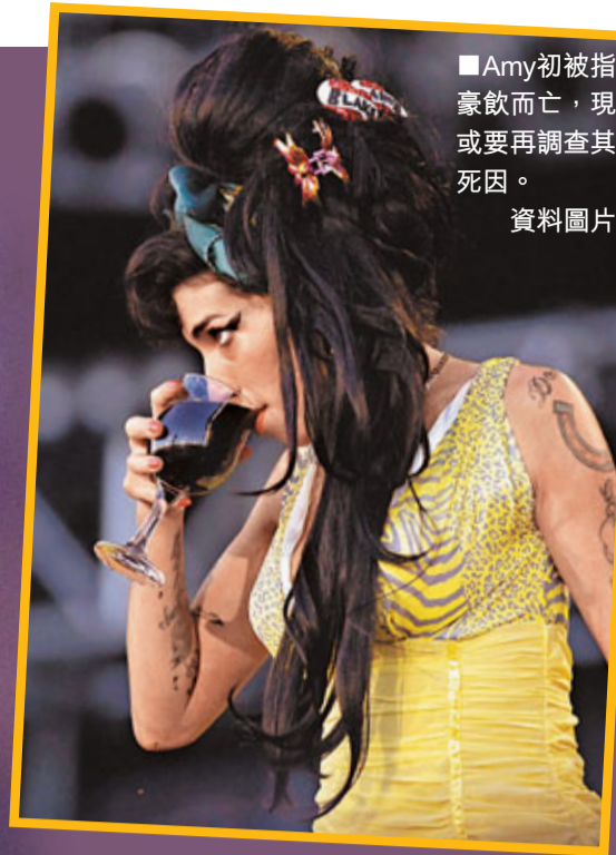
Amy初被指豪飲而亡，現或要再調查其死因。資料圖片