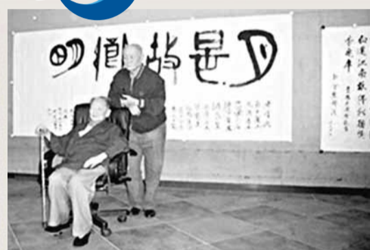
2006年，黃苗子在黃永玉的家鄉鳳凰題寫「月是故鄉明」後兩人合影。