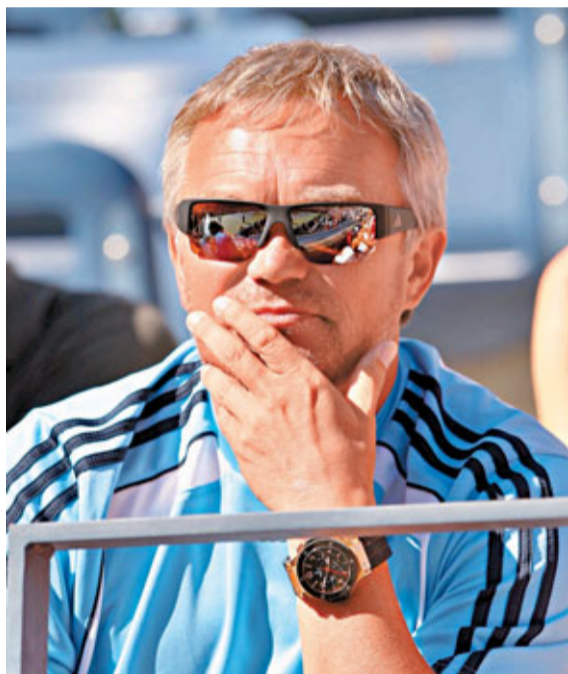
禾絲妮雅琪將由父親執教。