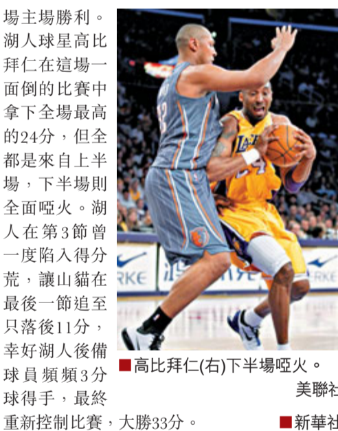
高比拜仁(右)下半場啞火。

湖人周二在主場以106:73痛宰「剋星」山貓，33分是湖人史上面對山貓取得的最大分差，亦是球隊今季第11