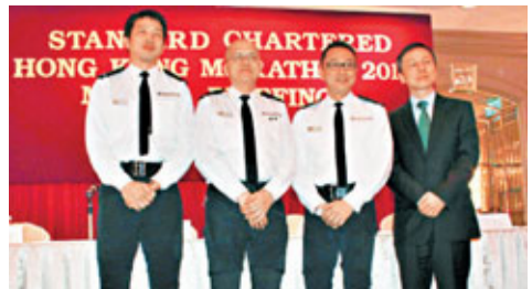
左至右：西九龍、新界南、港島的交通高級督察及運輸署代表講解賽事當日的封路情況。

主辦單位對新設的全馬和3公里輪椅賽十分重視。為防止各輪椅選手於急彎路段發生「撞車」意外，田總特意在灣仔、青馬和汀九大橋的危險路段裝置防撞海棉，以減少意外受傷機會，而醫護人員亦由去年的580人增添至600多人，賽事當日亦有10架救傷車隨時候命，讓醫護人員能以最短時間趕往意外現場。