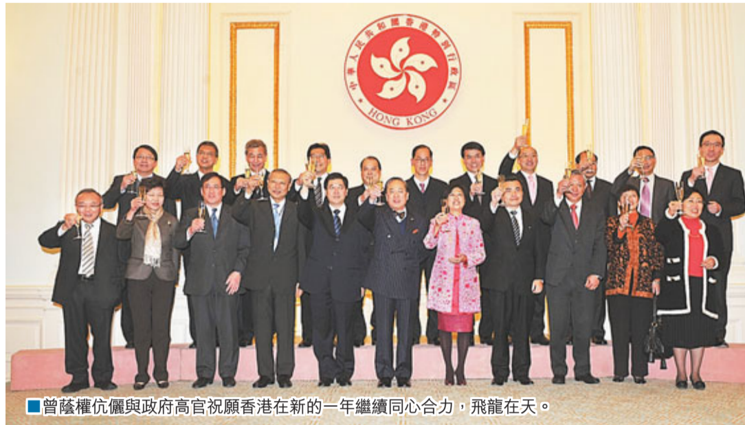
曾蔭權伉儷與政府高官祝願香港新的一年繼續同心合力,飛龍在天。

卸任在即的曾蔭權亦稱,新屆特首選舉定有一番「龍爭虎鬥」,明年今日,這個新春酒會亦會由下一任行政長官主持,但強調外處境雖變,他對香港的情懷及對港人的信任始終不變,並深信只要各界同心合力,香港的遠景一定繼續亮麗,一定可以「飛龍在天」。他祝願神州大地繁榮昌盛、「龍騰四海」,香港市民身壯力健、「矯若游龍」。