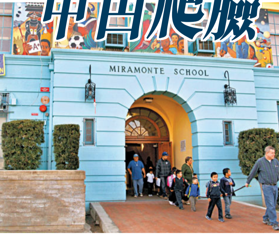
伯恩特在米拉蒙特小學任職多年。