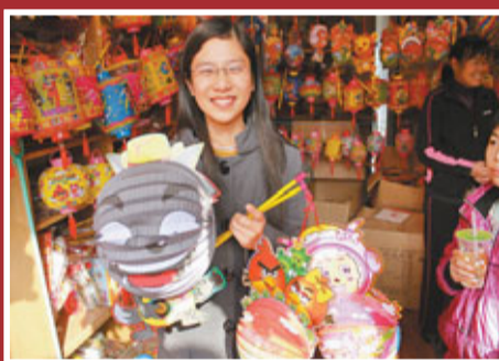
以網絡遊戲主角為元素設計的花燈在福州頗為走俏。

就有送花燈的習俗。許多花燈的寓意均與福州民俗息息相關，如觀音送子燈，是母親給出嫁的女兒第一年未生子送燈；第二年有了孩子後，要送孩兒坐盆燈；第三年孩子長大了，送狀元騎馬燈。