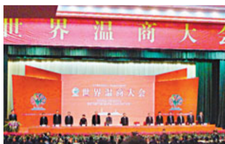
首屆世界溫商大會現場。

此次大會，溫州所屬各縣(市、區)和功能区均拿出大量項目與溫商對接，使得項目推介和簽約成為本次大會的「重頭戲」。據悉，此次溫州市共推出538個重點招商項目，計劃吸引總投資額6280億元。推介項目涉及金融業、總部經濟、現代商貿業、公共服務業、旅遊開發、交通建設、先進製造業等七大板塊，向世界溫商伸出回鄉創業、實業回歸的「橄欖枝」，共建共享溫州發展成果。