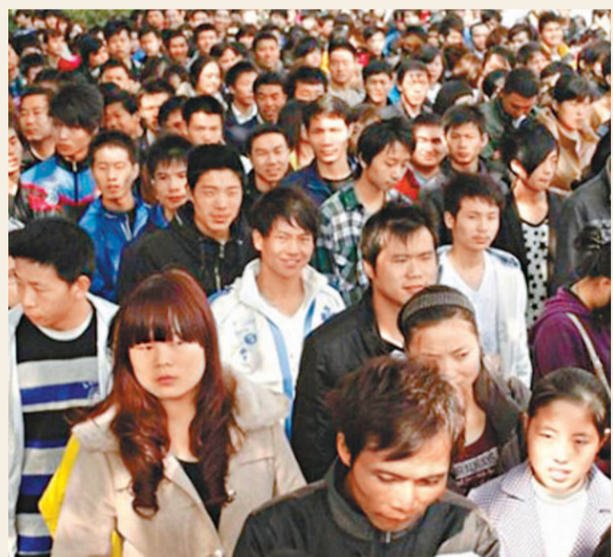
深圳富士康應聘隊伍。

有市民提出「美國大使館的數據為何與市環保局發佈的數據不一致」，于建華解釋說，首先，要看美國使館的檢測有無實驗室支持，「實驗室是空氣質量數據發佈的保障，儀器校準等工作需由專業人員維護，否則將產生很大差距。」其次，按照國際慣例，監測點應離污染源50米以外，但美國大使館的監測點設在路邊，離污染源較近，設置不規範。