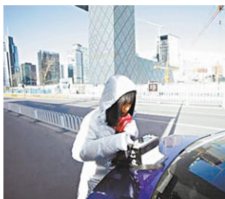
北京民間團體測量空氣質量。

查和儀器檢測相結合的方式，嚴格檢查。徹底查處各種危險品，確保萬無一失。要同四省藏區做好協調工作，告知藏區群眾自3月1日起，凡進藏人員，必須攜帶本人身份證方可進藏。要通力協作，進一步建立健全維穩協作機制，爲守好拉薩的「東大門」而努力工作。