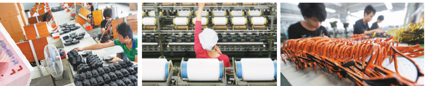
■當前小型微型企業經營壓力大、成本上升、融資困難等問題仍很突出, 需要進一步加大支持力度。