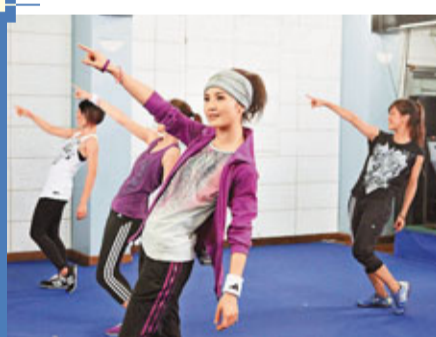
香港文匯報訊(記者凡文)蔡卓妍(阿Sa)(見圖)早前為一運動服裝品牌的春夏女裝服飾系列拍廣告,鏡頭下的阿Sa顯得活力十足,阿Sa搞笑地將拍攝過程形容為如同參加運動會般,因一次過要做齊拗腰、拉筋及跳舞等連串動作,就如參加了運動會不同的比賽項目。阿Sa更大爆早為拍攝今次廣告中的Dance系列而做足準備,在洗澡時也爭取時間練習基本步,令自己保持靈活性,認真善用時間。

踏入龍年,阿Sa的工作已經排得滿滿,首先是下月將與阿嬌再推出Twins的最新廣東專輯。Twins對這張專輯非常期待,整個製作過程也很花心機,由選曲詞至編曲都很投入。問到今年的工作展望,阿Sa盼望獲得好劇本,實行歌影雙線發展,阿Sa說:「近年參與的電影工作比較少,隨着心態上的改變,其實一直都在等待好劇本的出現,期待着一個自己滿意的劇本,能使我更加全情投入於演戲當中。」