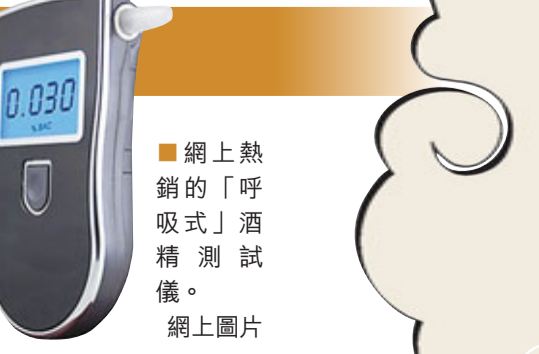
■網上熱銷的「呼吸式」酒精測試儀。

專家：自測風險很大 據了解，目前中國對買賣酒精測試儀沒有法律規定。有專家稱，交警使用的測試儀不僅需要經過技術監督部門的檢驗，還要定期校準。而市場上銷售的測試儀是否達標很難判定，私自購買並用於自測風險很大。