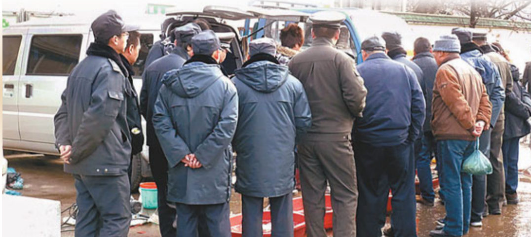
■攤主抵擋不住城管們的「緊盯圍觀」，匆忙撤攤。

對於這張引起熱議的照片，記者隨後採訪了當時的城管執法隊歸屬的南京市城管局鎮村街道執法中隊，該處的負責人竹科長表示，據照片中的執法隊員解釋，他們並非是在用「圍觀」眼神逼退小販，照