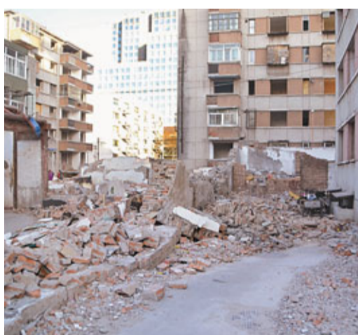
■被拆除後的北總布胡同24號廢墟。

他說：「文革時候要拆，誰敢說話啊，但是到了現在，類似這樣的名人故居必須加強保護，這都是寶貝啊。」據悉，東城區文化委已通知建設單位，不得繼續拆除現存院落的原有歷史建築，並對落架後的全部傳統建築材料妥善保存。同時，東城區文化委將委託有資質的設計單位，在完善實測資料的基礎上，制定復建方案。