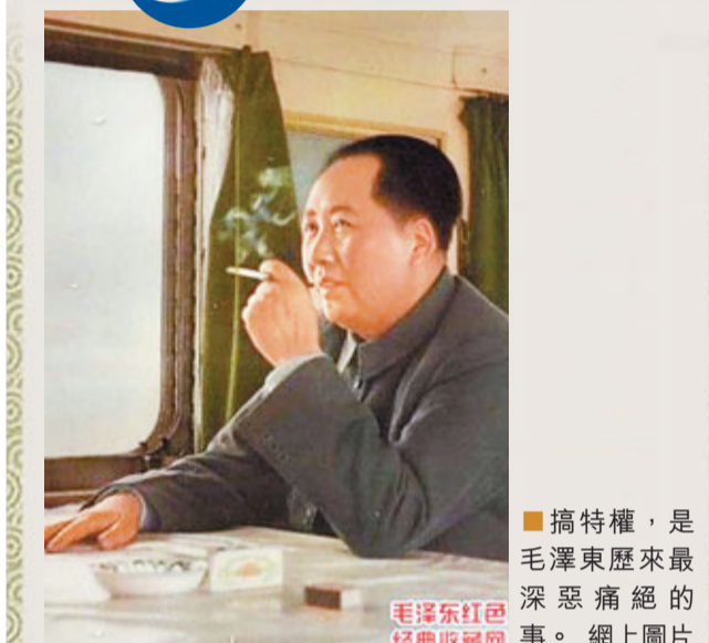
■搞特權，是毛澤東歷來最深惡痛絕的事。