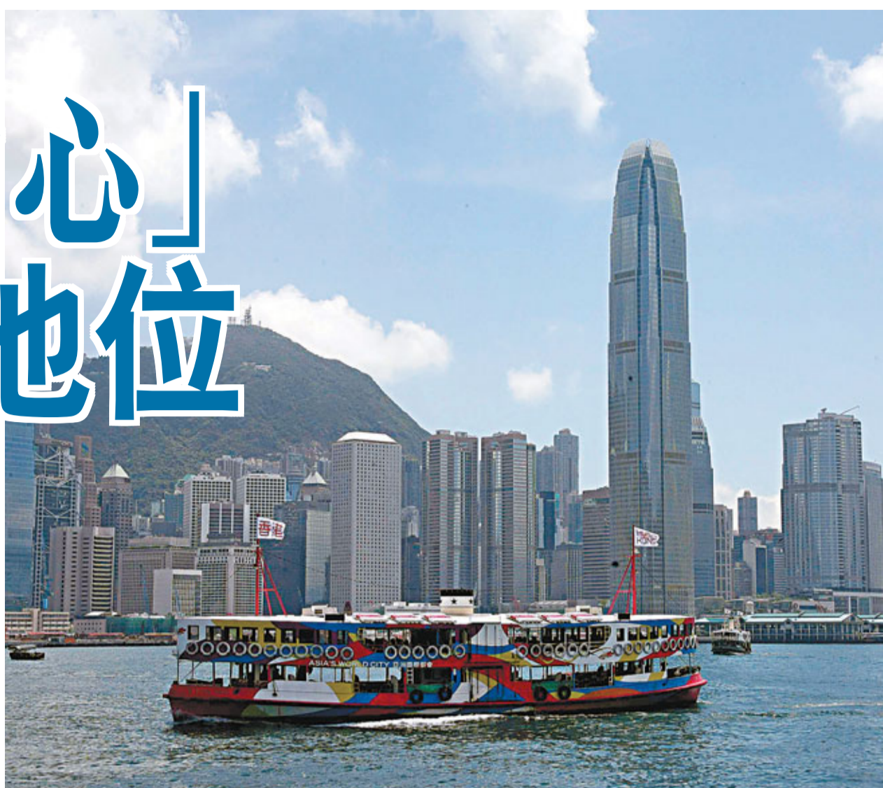
專家指出，本港應把握先機盡快推出更多的人民幣產品。