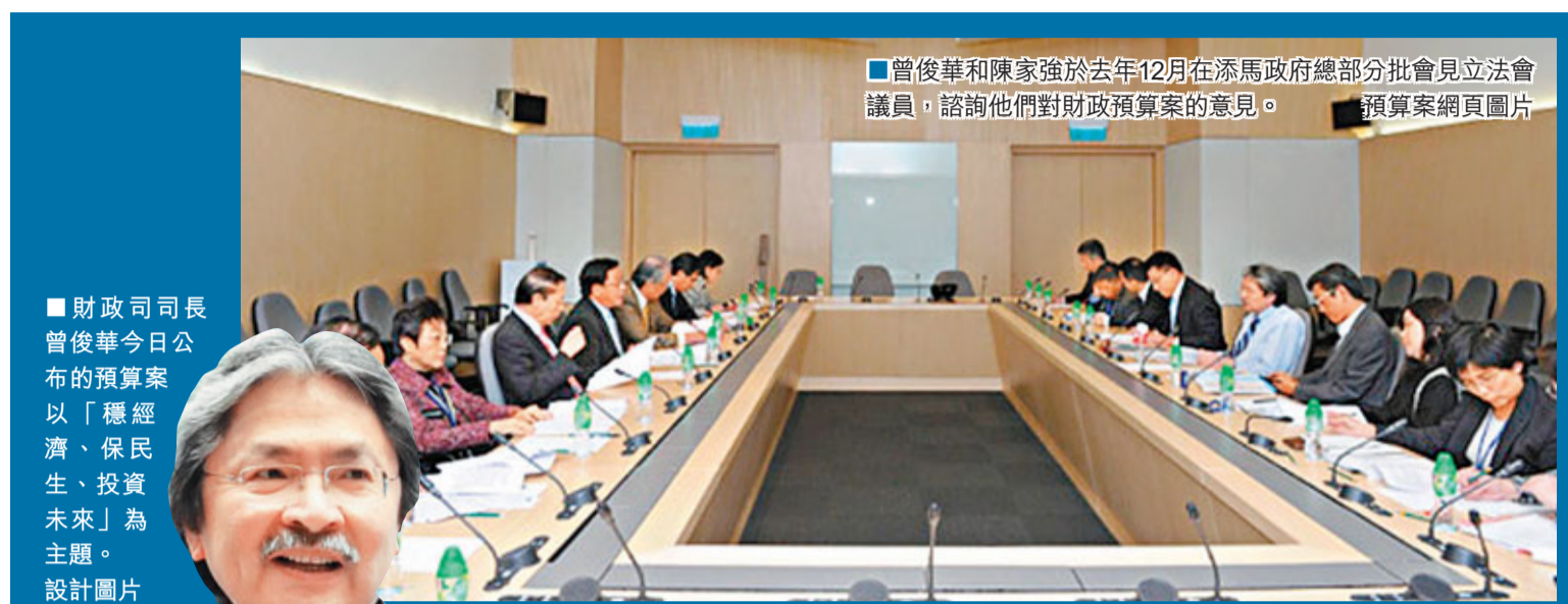
曾俊華和陳家強於去年12月在添馬政府總部分批會見立法會議員，諮詢他們對財政預算案的意見。

譚志源希望方案在現屆立法會內可獲通過，但「謀事在人，成事在天」，政府會做可以做的事情，自己撫心自問，今次提出的方案是個適當的方案，希望市民可以接受。