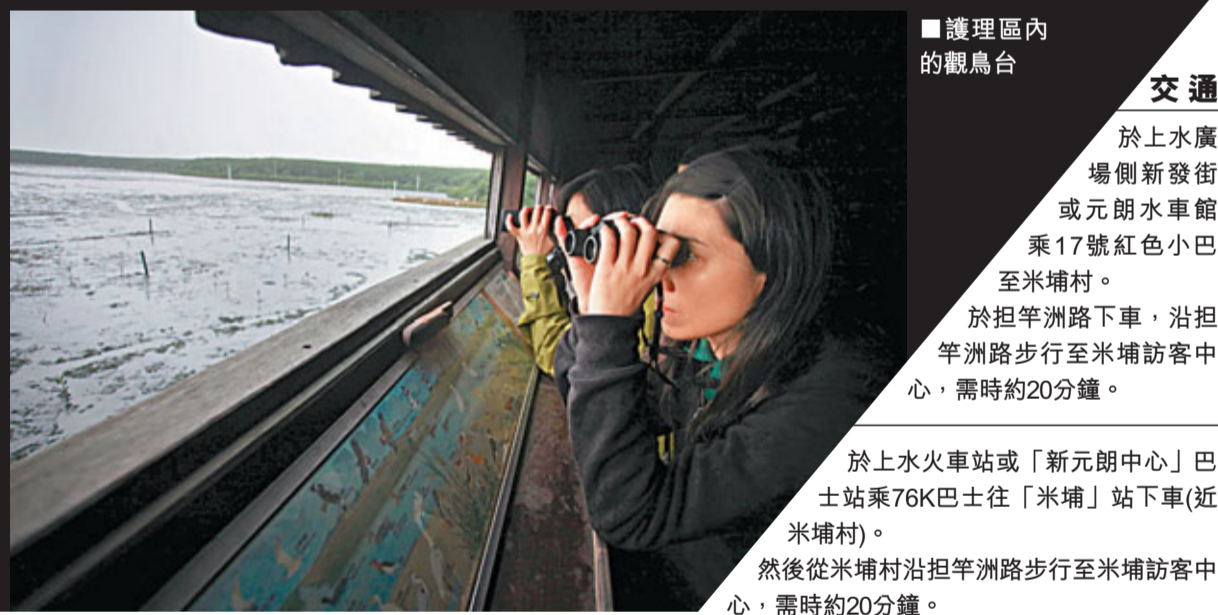
護理區內的觀鳥台

喜歡行山和觀鳥的遊客，可以多關注世界自然基金會香港分會的網站http://www.wwf.org.hk/以獲取最新的資訊。