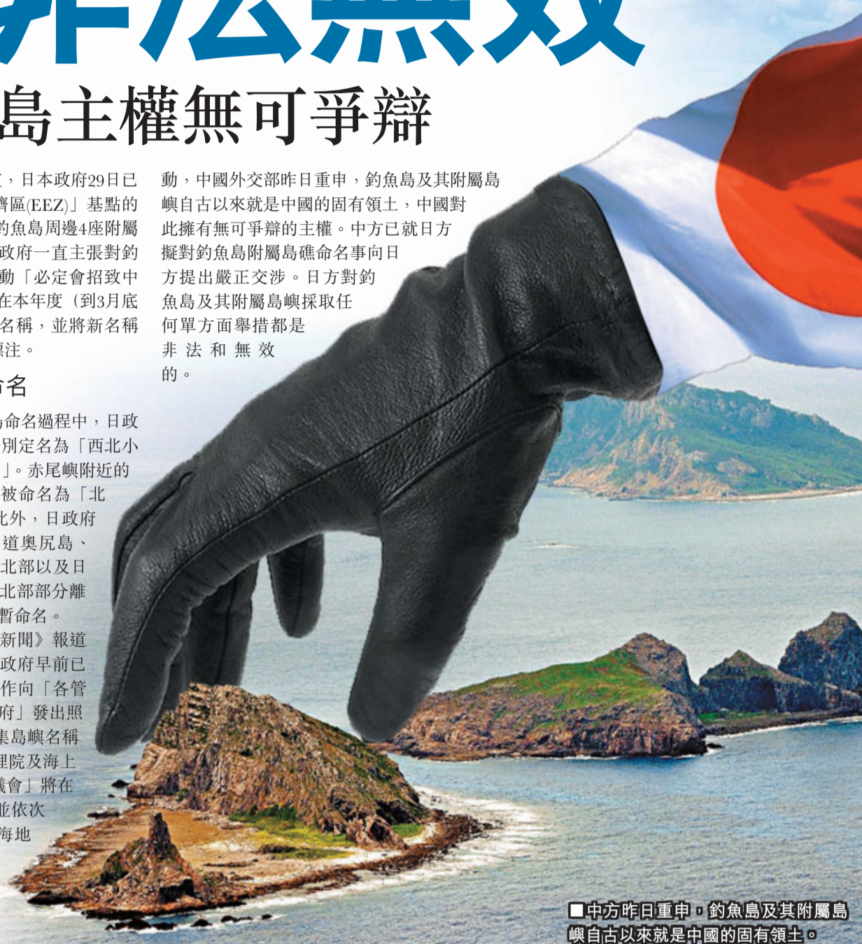
中方昨日重申，釣魚島及其附屬島嶼自古以來就是中國的固有領土。