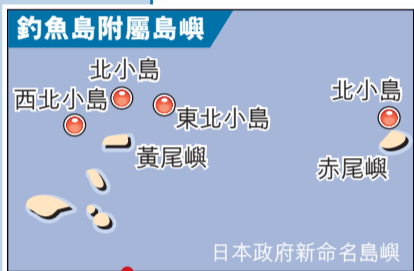
釣魚島附屬島嶼 西北小島 北小島 東北小島 黃尾嶼 赤尾嶼 日本政府新命名島嶼