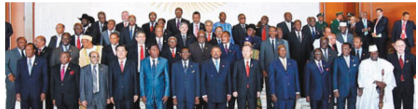
非洲聯盟第十八屆首腦會議開幕式。