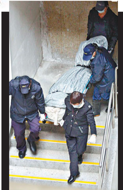
■ 件工將被殺保安員的遺體昇離彩華樓。

此宗兇案於昨晨7時半發生，警方最初只通知傳媒「發現傻人」，沒提及有人遇襲喪命。直至事發後3小時，約上午10時45分，才通知傳媒有人被斬死。有人批評警方沒有履行承諾，盡快向傳媒公布案件詳情，警方只回應表示需時間了解案情及性質。