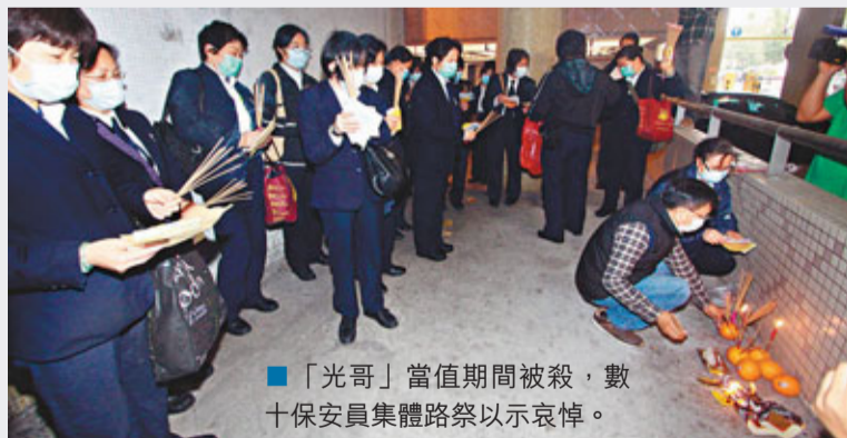
■ 「光哥」當值期間被殺，數十保安員集體路祭以表哀悼。