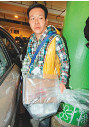
■ 重案組探員檢走一批與案有關證物。