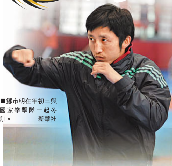
鄒市明在年初三與國家拳擊隊一起冬訓。