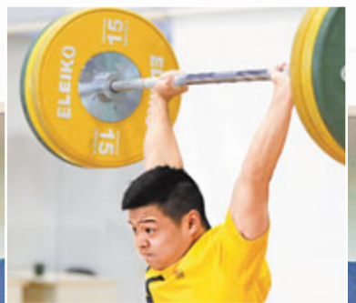
奧運舉重冠軍龍清泉廿九仍在訓練。

「運動員必須保證全年連貫的訓練才能保持競技狀態，這本身就是一個偽命題。」該業內人士表示，「中外已有太多的例子可以證明，只有那些被動地投身到競技體育中的運動員，才需要借助外力強壓保持競技狀態。那些真正對運動項目有熱情的運動員，競技狀態的好壞通常並不由訓練時間的多少決定。」