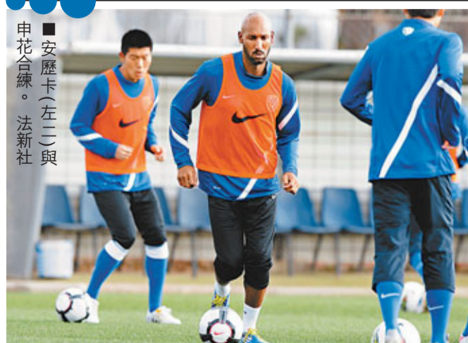
安歷卡(左二)與申花合練。