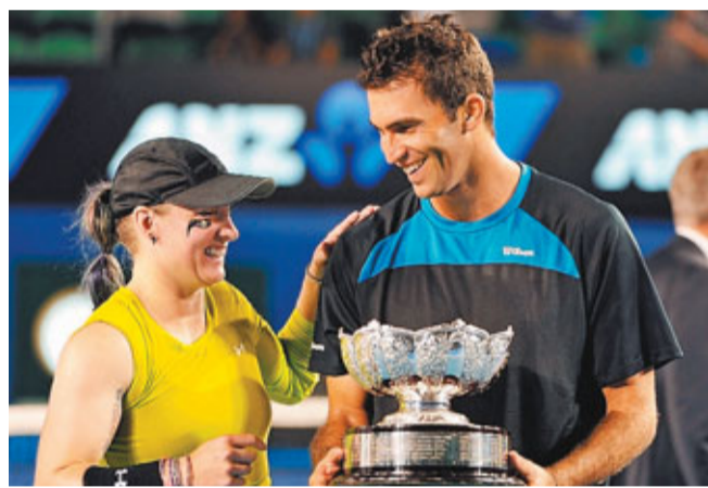
■美國選手馬泰克(左)和羅馬尼亞選手特卡烏在混雙決賽中奪得冠軍。

在2012年澳洲網球公開賽29日進行了最後一天的角逐。在率先進行的混雙決賽中，來自美國的馬泰克和羅馬尼亞人特卡烏最終擊敗了維斯妮娜/佩斯組合，成功捧起了混雙獎盃。