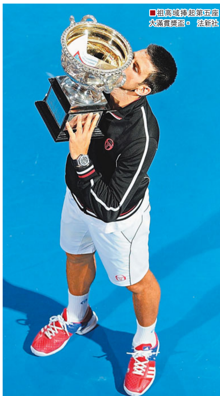
■祖高域捧起第五座大滿貫獎盃。

境，結果氣勢如虹的祖高域毫不客氣連搶四分以Love Game破發，從而以6:2再下一盤逆轉領先。 第四盤，前兩局兩人雖然都完成保發，但過程均甚為艱難。搶七局中，雖然拿度率先破掉祖高域的發球分以3:2領先，不過關鍵時刻祖高域連續失誤，結果拿度連下4分以7:5拿下搶七局，將比賽帶入到決勝盤。 第五盤決勝盤，第9局開局祖高域突然體力不支，一次31拍的精彩回合後祖高域直接累倒在地，之後又累到把球拍丟在地上。在第12局，祖高域發球冠軍局挽救一個破發點後逆轉保發，從而以7:5贏得決勝盤，進而在一場跌宕起伏的經典五盤大戰中3:2擊敗拿度成為2012年澳網男單冠軍，比賽結束時已經是澳洲當地時間1月30日凌晨1點38分。