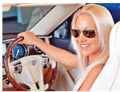
香車美人再配至型黑超，方夠「殺食」。