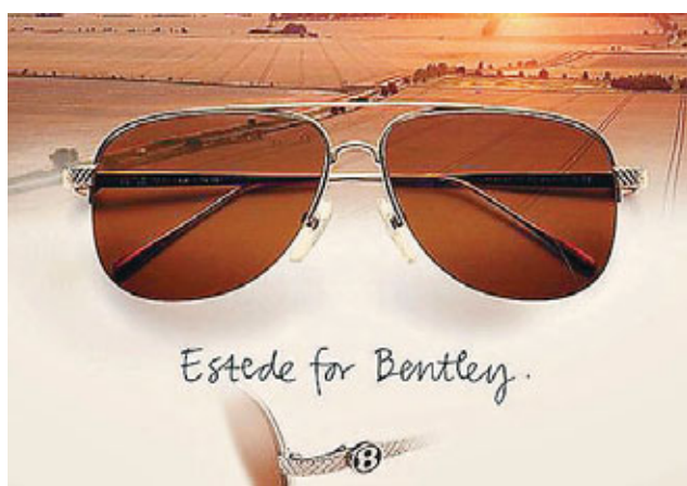
太陽眼鏡框可鑲鑽石。網上圖片

除了全球限量100副的獨立編號限量版外，賓利另外還推出18K黃金、玫瑰金或白金版本，售價為6,400英鎊(約7.8