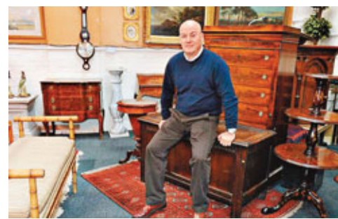
基恩把古董傢俬運到北京出售，獲利豐厚。