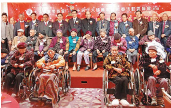
大埔區「耆老千歲宴」邀請6,500名73歲或以上長者聚首一堂，人數為歷年新高。