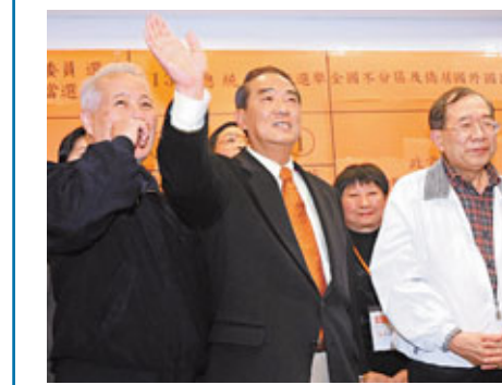
■宋楚瑜得悉落選後,向選民謝票。資料圖片

據中社29日電 台灣大選結束後鮮少露面的親民黨主席宋楚瑜,動向仍受政壇關注。據橋樑黨團表示,宋楚瑜將於2月1日「立法院」即將開議,親民黨「立法院」黨團正式成立時,公開與大家見面,並發表對選後政局的看法。