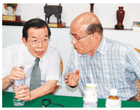
■謝長廷(左)和蘇貞昌或競逐黨魁的暗湧。資料圖片

這一任民進黨代理主席的重要任務,包括兩件大事,一是辦理5月進行的黨主席選舉;二是召開黨內檢討會議,針對黨的路線、組織、兩岸、經濟等各項政策進行檢討及改革。而被視為有實力角逐下屆主席的蘇貞昌與謝長廷,兩人都歷經民進黨成長、挫敗、恢復的過程,若是決意角逐主席地位,將難以迴避對民進黨8年執政以及兩岸政策、黨的路線進行大辯論,以釐清日後方向。