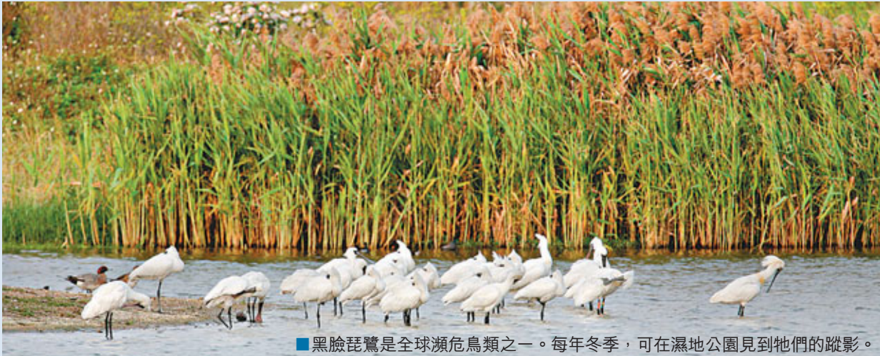
■黑臉琵鷺是全球瀕危鳥類之一。每年冬季，可在濕地公園見到牠們的蹤影。

香港文匯報訊（記者 文森）香港濕地公園昨日慶祝2012世界濕地日，今年的主題為「濕地與旅遊」。