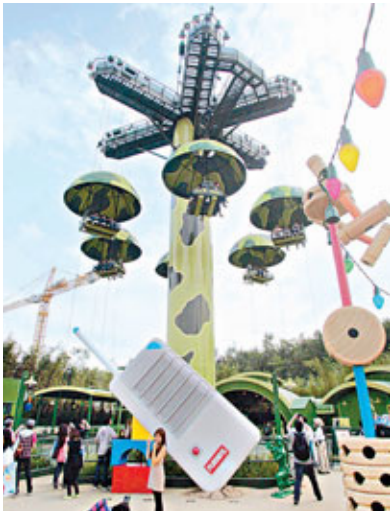
■圖為迪士尼樂園「玩具兵團跳降傘」機動遊戲。 資料圖片

香港文匯報訊（記者 林曉晴）本港兩大主題公園香港迪士尼樂園及海洋公園，其機動遊戲昨日都發生電力及信號故障，其中海洋公園停電事故令「高峰樂園」內的6個機動遊戲受到影響，而迪士尼的信號故障則令「玩具兵團跳降傘」暫停，使36名旅客「半天吊」，但2宗事故均沒有造成任何人受傷。迪士尼在事發後立即向機電署通報事故，但海洋公園則沒有主動通報，更未有交代受影響人數。海洋公園表示，因事故性質輕微，毋須向機電署申報。