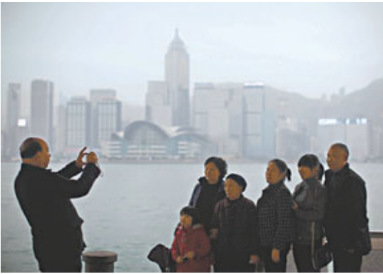
■春節期間市民外遊人數及訪港外籍客同告下跌，惟內地遊客上升3%至4%。圖為訪港客在維港留影。

至於春節港人外遊「避年」的出境遊人次，按年跌10%至12%，以廣東團的客量跌幅最大，整體營業額按年