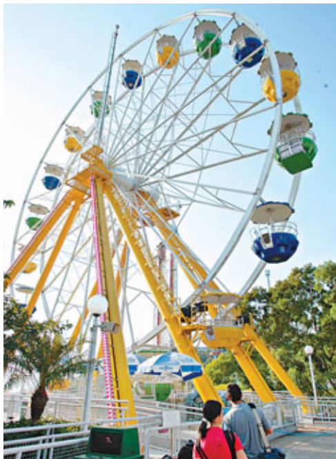
■海洋公園電力故障，6個機動遊戲停頓，部分旅客於摩天巨輪受困15分鐘。 資料圖片