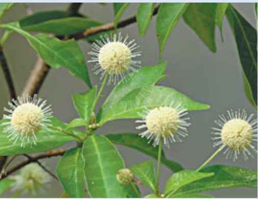
■春夏季公園滿目青翠，亦有繁花點綴，例如水團花。