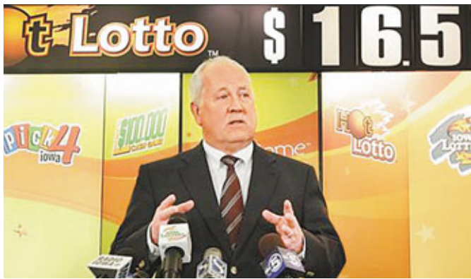
彩票公司總裁稱今次事件的所有疑團及推測足以寫成書。

本港周二的六合彩攪珠，估計頭獎彩金達7,000萬港元，令不少市民引頸以待；而在美國，一名頭獎幸運兒竟放棄1,430萬美元(約1.1億港元)彩金！艾奧瓦州一名代表律師上月試圖領獎，卻堅拒透露得獎者身份，彩票公司拒絕派彩，他寧選擇放棄彩金了事。事件疑團重重，引起當局展開刑事調查。