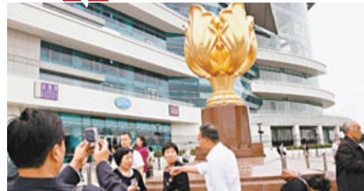
■零售和旅遊業今年表現會較往年為佳，大有進步空間。

柏天心指，零售和旅遊業五行屬水，與天干地相合，因此五行屬水的行業可以一枝獨秀，愈來愈旺盛。麥玲玲亦認為，旅遊、運輸及物流等屬水的行業，今年整體表現會較往年為佳，大有進步空間，不妨選一些心頭好加進自己的投資組合。蘇民峰指，雖然今年「水」排尾二，但排名較兔年的包尾為高，故屬水的股份股價有上升空間。他個人認為，銀行及保險業亦屬水，尤其向好內銀及內險股的走勢。其實近日內銀股價已見起動，因溫總曾出言會托市，市場憧憬中央放水，中行（3988）及建行（0939）年初至今已升逾15%及12%。