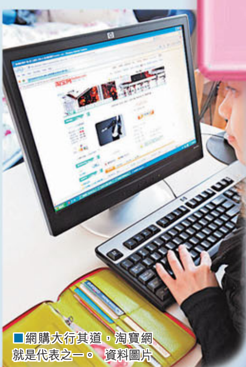
網購大行其道，淘寶網就是代表之一。資料圖片