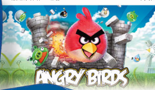
Angry Birds 龍版賀龍年

Rovio稱，fb憤怒鳥可以全螢幕視窗讓用戶操作，也會提供較佳動畫品質；另會引進類似「地震」或「大力鳥」之類的新寶物，讓玩家在線上購買或在遊戲進行中獲得；又會有社交功能，像排行榜形式，讓玩家可以炫耀戰績。