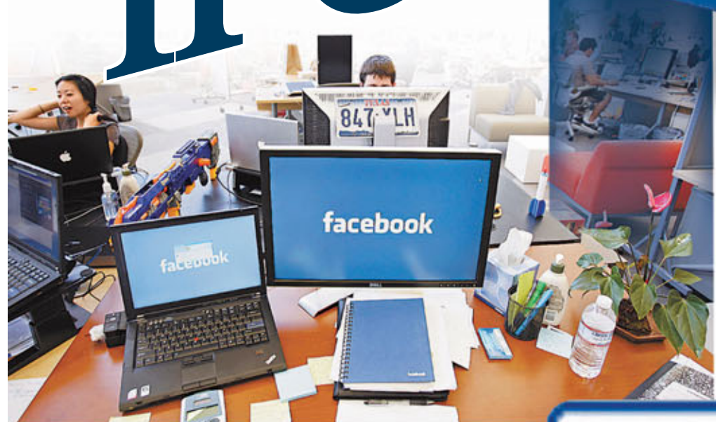
fb總部辦公室。資料圖片