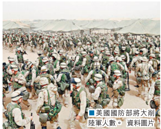
■美國國防部將大削陸軍人數。

美國債台高築，新財年國防預算將自1998年以來首次削減。國防部長帕內塔前日公布，美軍將於今後5年大幅削減10萬名陸軍與海軍陸戰隊兵員。共和黨資深參議員麥凱恩炮轟新方案是「忘卻歷史教訓」，指美軍將不能有效應對未來數年的事態發展。