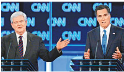
■金里奇(左)和前麻省州長羅姆尼(右)辯論。

雖然美國太空總署(NASA)早在2006年已宣布，要在2020年左右於月球南端建立「殖民