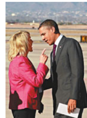
■奧巴馬被布魯爾當眾指罵。