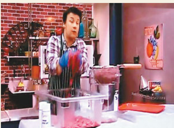
■Jamie Oliver示範製作「粉紅泥渣」的過程。

美國連鎖快餐店麥當勞及漢堡王陷入「牛肉醜聞」，英國星級廚師Jamie Oliver去年在電視節目批評快餐店在漢堡包的牛肉中，摻雜經阿摩尼亞消毒的牛肉渣，他更親自示範其製作過程，有人將之稱為「粉紅泥渣」（右圖）。麥當勞及漢堡王先後決定不再採用含牛肉渣的漢堡扒，但否認受輿論壓力而屈服。香港麥當勞回應稱，本港與美國方面的牛肉供應商不同，但仍需了解有否採用同一配方。