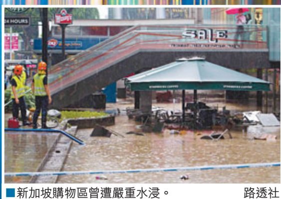
■新加坡購物區曾遭嚴重水浸。