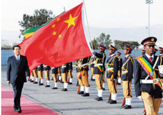
27日,中國全國政協主席賈慶林抵達亞的斯亞貝巴。

據新華網27日電 應非洲聯盟和埃塞俄比亞政府邀請,全國政協主席賈慶林當地時間27日下午抵達亞的斯亞貝巴,開始對埃塞俄比亞進行正式友好訪問,並出席非盟第十八屆首腦會議開幕式。