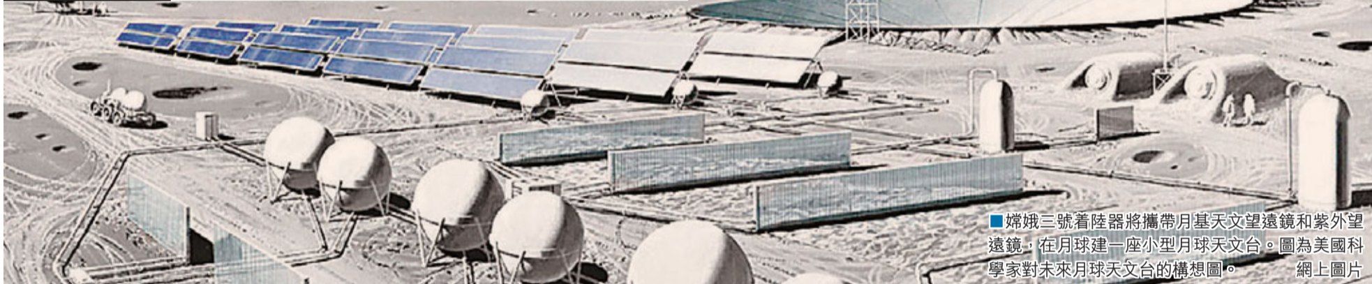
嫦娥三號著陸器將攜帶月基天文望遠鏡和紫外望遠鏡,在月球建一座小型月球天文台。圖為美國科學家對未來月球天文台的構想圖。