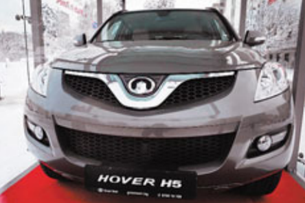
一輛長城哈弗H5在保加利亞車行展銷。