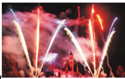
加州迪士尼樂園年初三燃放煙花,慶祝中國龍年到來。

據洛杉磯旅遊局統計,去年到洛杉磯旅遊人數達2,690萬人,國際遊客近600萬人,消費額高達55億元。其中上升速度最快的是中國遊客,佔遊客總數的1/4。旅遊局長利伯曼說,洛杉磯每10份工作中就有一份和旅遊業有關。