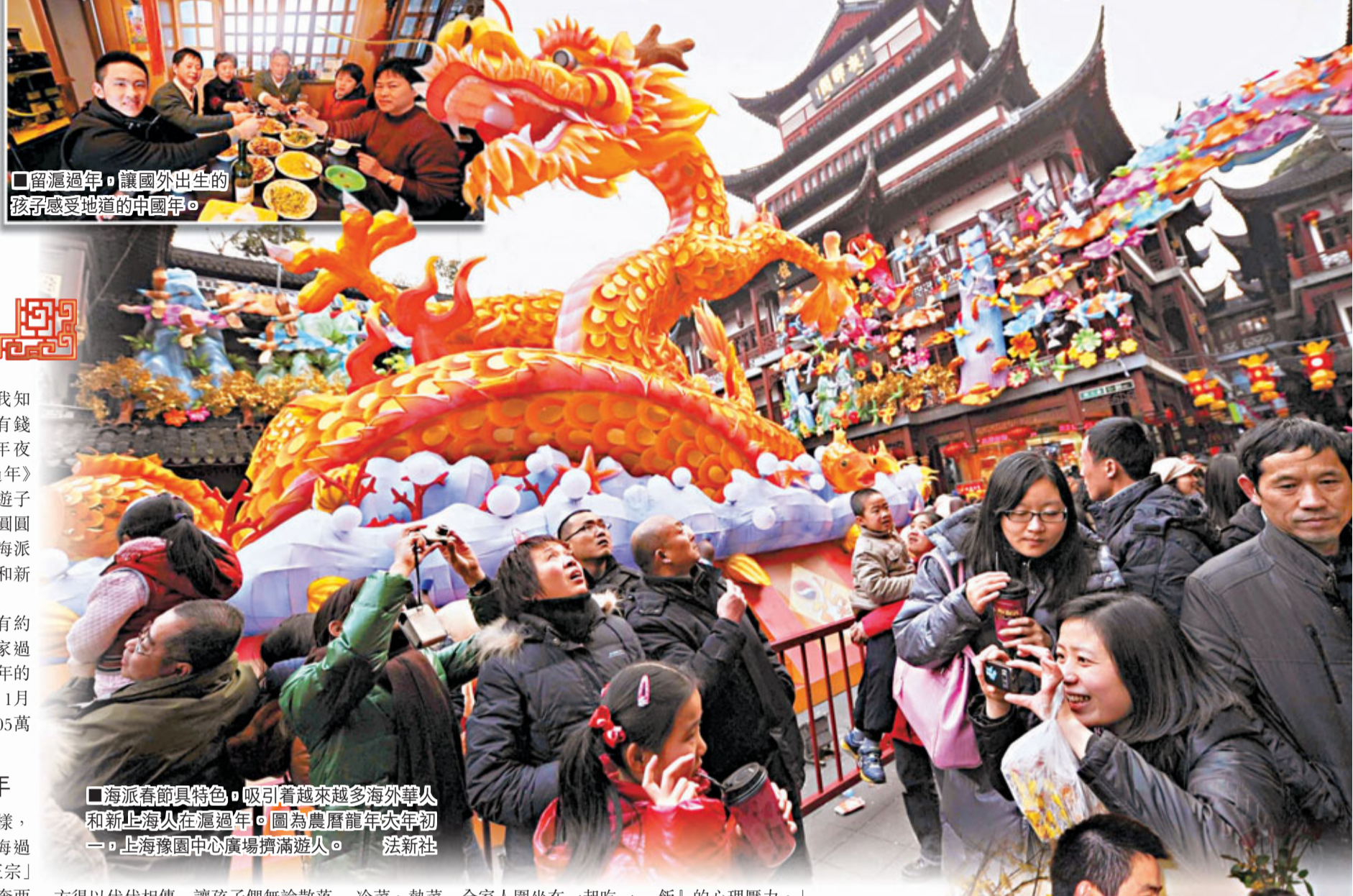
■留滬過年，讓國外出生的孩子感受地道的中國年。