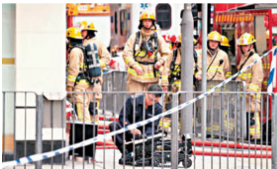
警方出動「獨眼龍」拆彈機械人引爆可疑物品。

香港文匯報訊(記者 杜法祖)旺角恒生銀行分行門外昨晨發生炸彈驚魂。一名神秘女子在銀行門外放下可疑紙盒後匆匆離去，警方接報恐是爆炸品大為緊張，馬上封鎖現場疏散人群，並即場把可疑物品引爆，證實為「詐彈」，紙盒內僅放有一個電子鬧鐘，警方正翻查現場一帶閉路電視錄影資料，追尋涉案神秘女子調查事件動機。