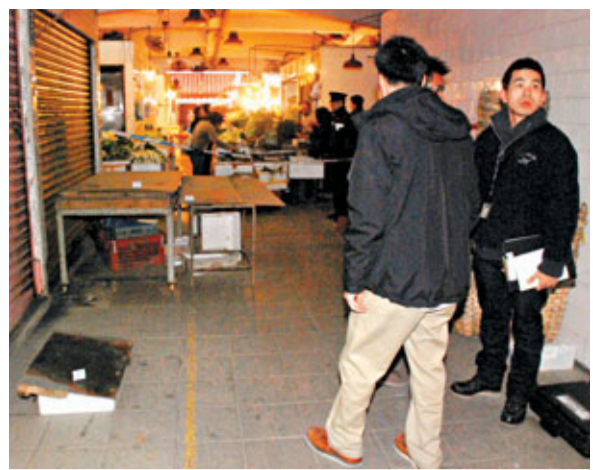
色魔在鴨脷洲街市內一菜檔對開通道木板上強姦女事主。

警方呼籲，任何人士如曾目睹案件發生或有資料提供，請致電2859 4258與調查人員聯絡，或致電2870 7200與香港仔警署報案室人員聯絡。