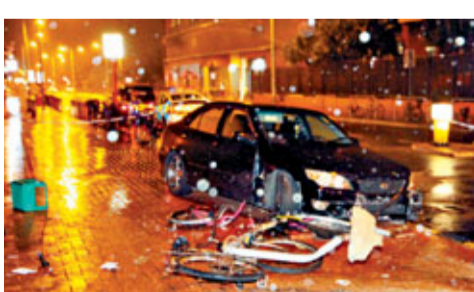
可疑私家車衝越警方路障撞傷警員後狂飆逃走，與警車追逐4.5公里後失事撞毀。

香港文匯報訊(記者 杜法祖)元朗昨凌晨1時許發生瘋狂駕駛撞傷警員事件。一輛可疑私家車衝越警方路障撞傷警員後狂飆逃走，與警車追逐4.5公里後失事撞毀，駕車男子棄車逃走反抗打傷2警，終被警員合力制服拘捕，事件中3名警員受傷送院治理。警方發現，涉案私家車的車主名下另一輛私家車日前亦涉及一宗瘋狂駕駛事件，正調查2案有否關連，以及駕車者逃避警方目的何在。