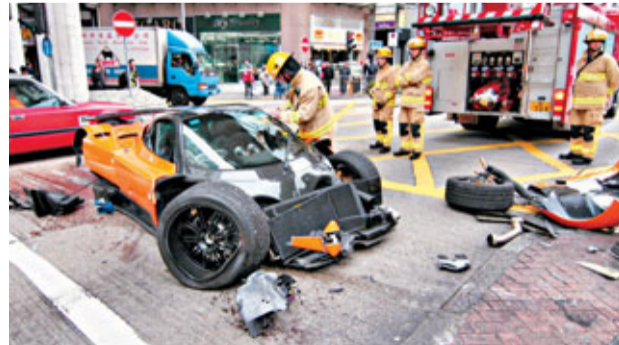
「幽靈之子」超級跑車在漆咸道南連環撞樹及交通燈後嚴重損毀，尾輪甩脫。

香港文匯報訊(記者 杜法祖)一輛有「幽靈之子」稱號的意大利Pagani橙色超級跑車，昨午1時許，沿尖沙咀漆咸道南往北行，途至近加連威老道時，突失控連環撞毀路中大樹及交通燈。車頭撞散，右尾輪甩脫。30歲姓沈(譯音)司機無受傷，事後通過酒精呼氣測試。