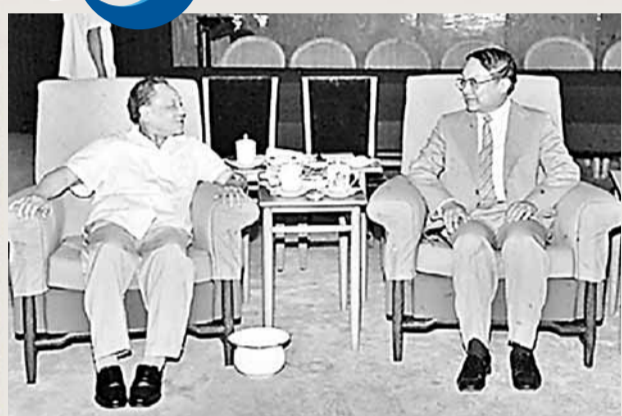
■鄧小平當年在北京人民大會堂接見金庸。