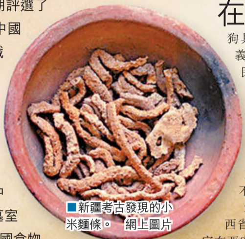
■新疆考古發現的小米麵條。

美國《考古學》雜誌近期評選了2011年度十大考古發現，中國考古工作者在陝西發現的戰國時期食物狗肉湯和在新疆發現的小米麵條入選。同時入選的還有蘇格蘭埋葬的千年北歐海盜船、約旦南部發現的類似競技場的1.2萬年前新石器社區中心、瑪雅神秘女統治者的墓室等等。這其中兩千年前的中國食物緣何入選？