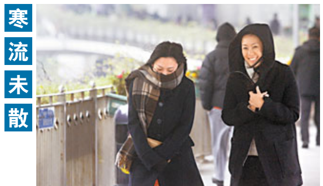
■昨日氣溫寒冷，市民穿上厚厚的衣服上街。

衛生署衛生防護中心發言人說，中心就與該個案有關的辦公室大樓進行徹底清潔和消毒後所抽取的合共451個水樣本，首批293個樣本的化驗工作已於農曆新年前完成，所有樣本均沒有超過行動水平的1個菌落形成單位，而餘下的158個樣本昨日得出最終