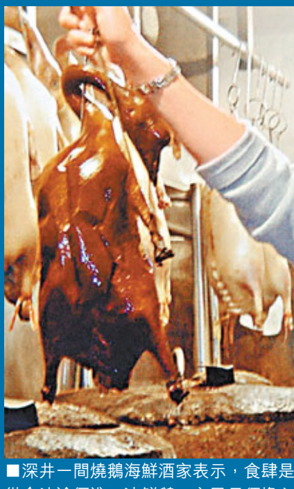
■深井一間燒鵝海鮮酒家表示，食肆是從合法途徑進口冰鮮鵝，市民毋須擔心食用安全。圖為著名的深井燒鵝。