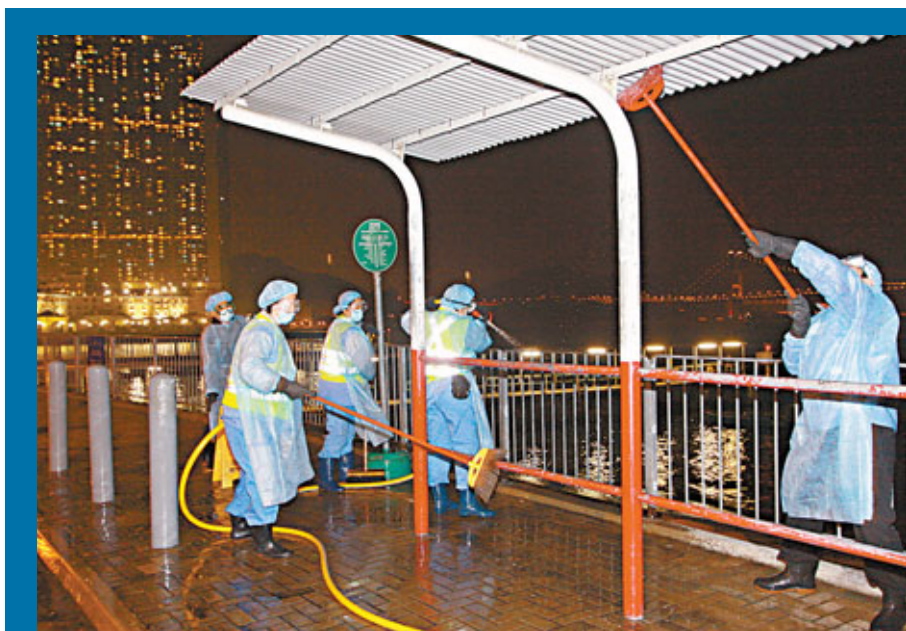
■穿上全套保護裝備的漁護署人員，昨日在馬灣碼頭至釣魚灣泳灘約100米長的範圍，以稀釋的漂白水進行徹底清洗，包括欄杆及巴士站上蓋等公共設施。

深井其中一間燒鵝海鮮酒家的員工表示，食肆是從合法途徑進口冰鮮鵝，市民毋須擔心食用鵝的安全，並指現時未發現生意受到影響。