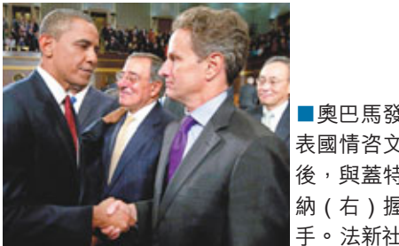
■奧巴馬發表國情咨文後，與蓋特納(右)握手。