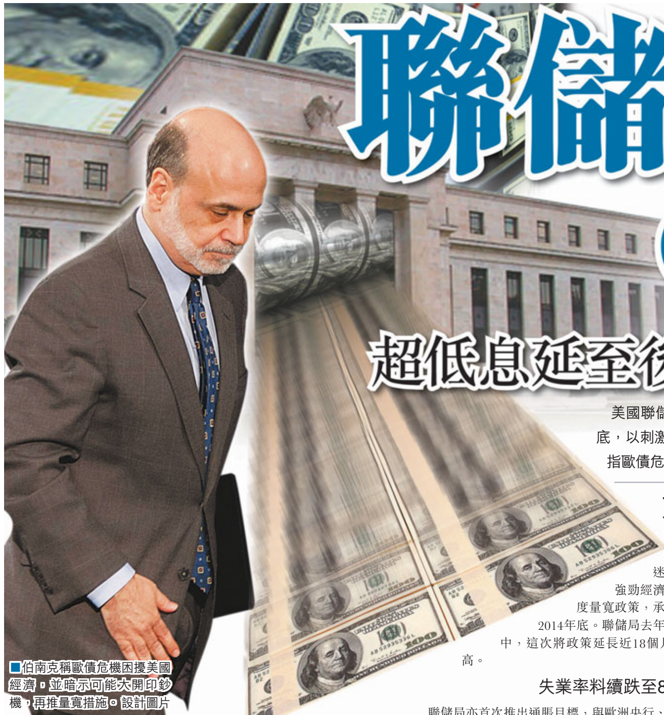
■伯南克稱歐債危機困擾美國經濟，並暗示可能大開印鈔機，再推量寬措施。設計圖片