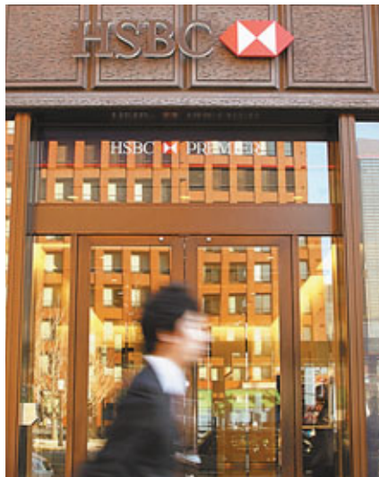
■匯控並非唯一面臨洗黑錢調查的大行。 彭博通訊社

事實上，匯控並非唯一一家面臨洗黑錢審查的大型銀行。在2009至2010年，美國監管機構指控巴克萊、萊斯銀行及瑞信集團規避美國法律，援助被制裁國家，3行同意被沒收合共12億美元（約93億港元）。2010年，蘇格蘭皇家銀行被指隱瞞荷蘭銀行與伊朗及利比亞等國家進行非法美元交易，被罰5億美元（約38.8億港元）。 ■路透社/彭博通訊社/《華爾街日報》