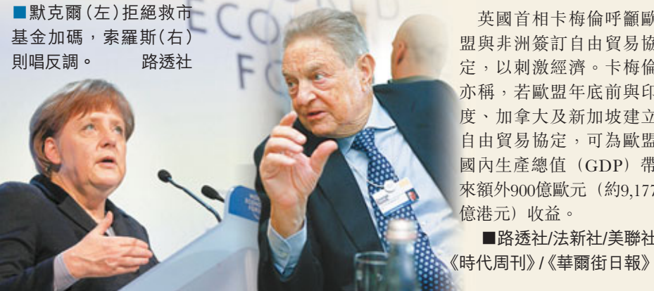
■默克爾(左)拒絕救市基金加碼，索羅斯(右)則唱反調。

索羅斯稱，歐洲當局應對金融危機的方式「完全錯誤」，明顯忽視金融市場運作機制。他指出，歐洲央行的再融資行動能有效紓緩銀行流動性緊張，但問題只解決了一半。他警告歐洲過度緊縮將觸發政治及社會問題，令經濟失控，歐盟無可避免會解體。