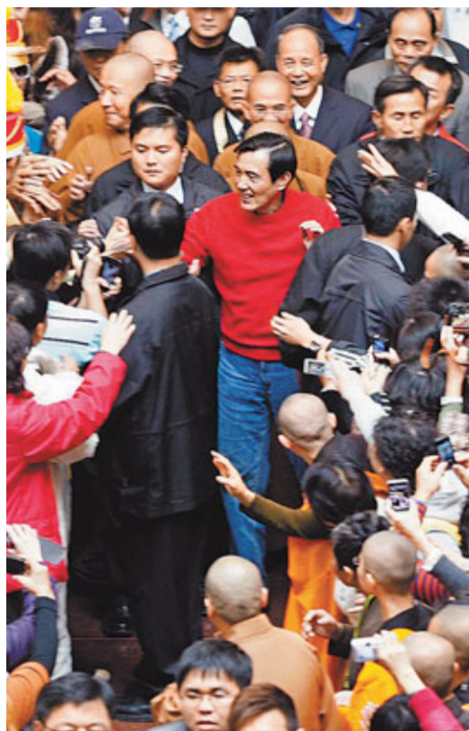
馬英九25日大年初三前往佛光山探視星雲大師，進入禮敬大廳時，受到擠爆的民眾列隊爭相握手。

而民進黨主席蔡英文在春節期間大多「宅」在家裡陪媽媽，大年初六再復出謝票。對於年後的「謝票感恩之旅」，蔡英文定調「沉潛、自省」，不會大張旗鼓安排媒體採訪。黨內高層也決定取消發放「小英紅包」，令不少支持者失望。