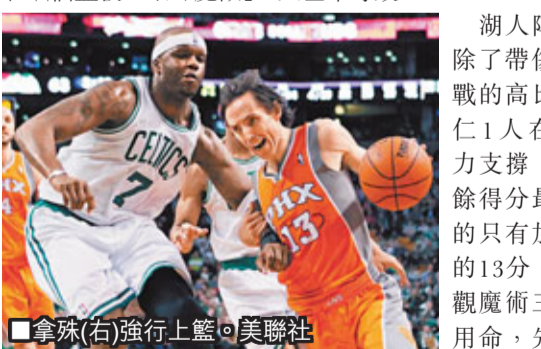
拿殊(右)強行上籃。

在以一波12：6開局後，魔術整場處於領先，始終壓制着湖人。懷特侯活在內線與風作浪，令湖人兩大中鋒拜林和加索無可奈何，兩人得分、籃板加起來才有23分和22個籃板，跟「魔獸」1人基本等效。