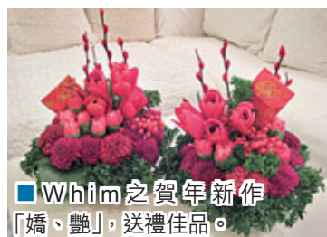
■Whim之賀年新作「嬌、艷」，送禮佳品。