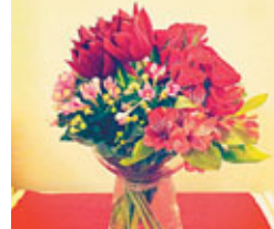
■Whim之賀年新作「花田喜事」。