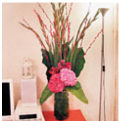
■糅合傳統與優雅品味的家居年花創作。