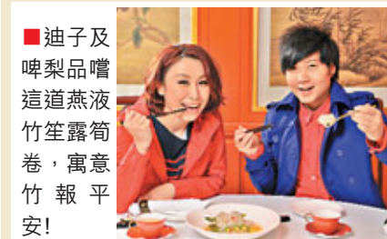
■迪子及啤梨品嚐這道燕液竹笙露筍卷，寓意竹報平安！