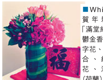
■Whim之賀年新作「滿堂紅」，鬱金香、十字花、小百合、繡球花、海葵（荷蘭）。

自由花藝工作者，Whim首席花藝師。曾遊歷歐、亞洲多國，考察與花藝相關的事物，最終希望創作品本土風格的花藝。此外，亦參與飾物創作及寫作等藝術工作。