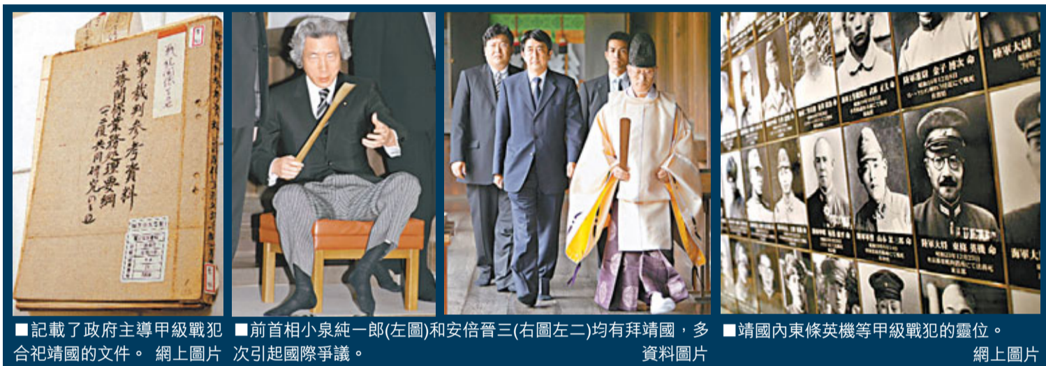
■記載了政府主導甲級戰犯 前首相小泉純一郎(左圖)和安倍晉三(右圖左二)均有拜靖國，多合祀靖國的文件。 網上圖片 次引起國際爭議。 靖國內東條英機等甲級戰犯的靈位。 網上圖片

入。《朝》指，上述文件曾保存在國立公文書館，聲稱對文件不知情的前厚生省官員說，如果知道，會改變答辯內容。靖國拒絕受訪。