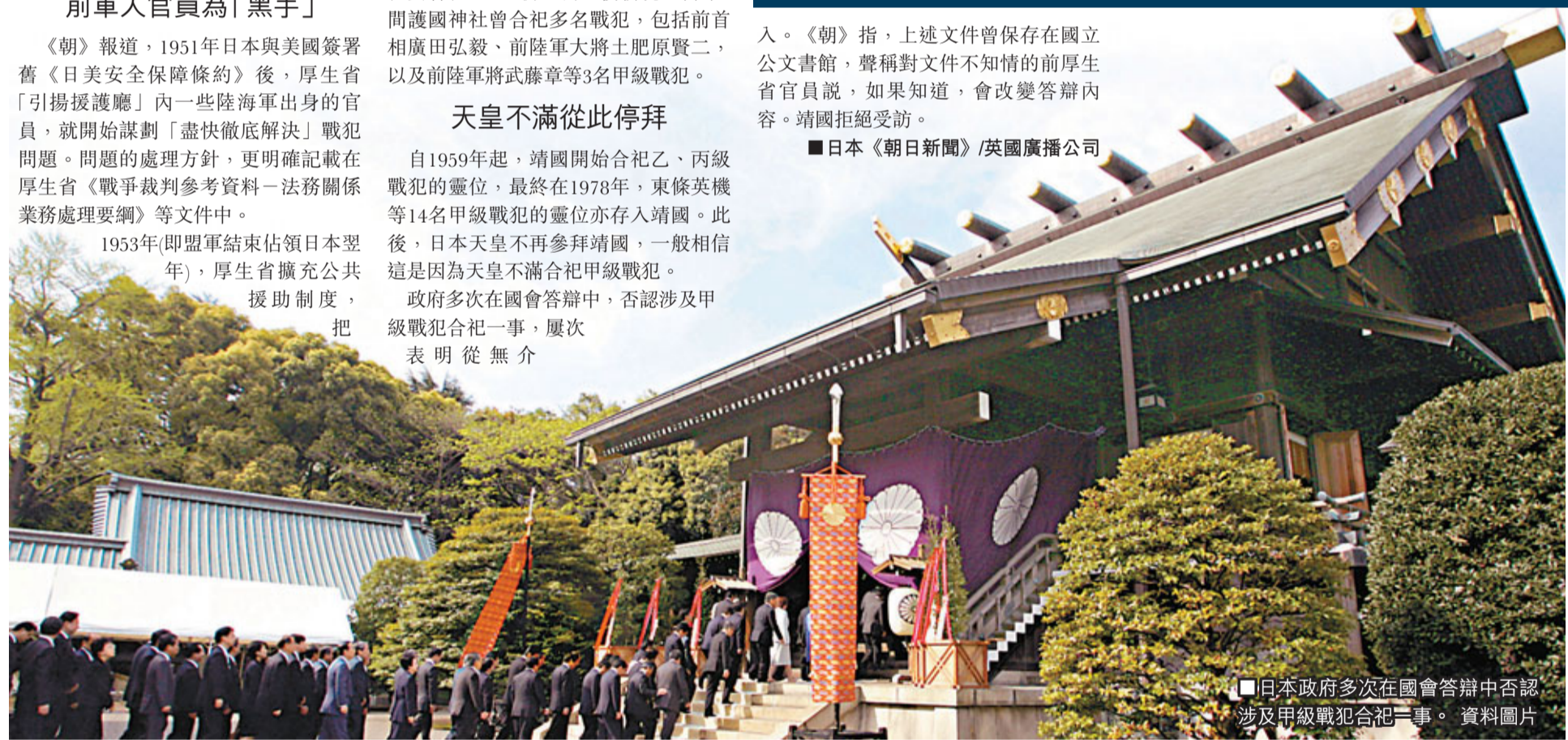
■日本政府多次在國會答辯中否認涉及甲級戰犯合祀一事。 資料圖片