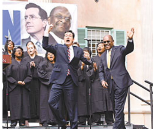
■科爾伯特(前左)呼籲選民投凱恩一票。

美國諧星科爾伯特為證明「金錢主宰政治」的歪風，以「試驗性質」參加周六的南卡羅來納州共和黨總統初選。他聯同前薄餅店老闆、因接連爆出醜聞而退選的黑人前參選人凱恩，惡搞了一場「冒牌」拉票活動，呼籲選民投凱恩一票，並解釋：「凱恩就是我。」稱二人的政治理念相同，但他的名字未能進駐選票上，凱恩的名字則選在。他表示，若凱恩獲得足夠選票，他便視為應該正式宣布參選。