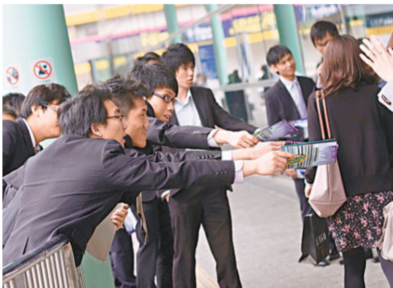
■地產代理為保生意，誓「爭崩頭」搶新盤客。 資料圖片

香港文匯報訊（記者 梁悅琴）今年1月份二手樓交投持續淡靜，業界估計，1月份地產代理生意或見紅，為保生意額，加上部分一手盤亦會於新春期間推售，各大地產代理行一如以往派發「新春開單利是」鼓勵前線同事於新春假期爭取生意，其中中原的「新春開單利是」倍升至1,000元，實行採取重賞策略激勵士氣。