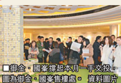
■御金·國峯撐起本月一手交投。 圖為御金·國峯售樓處。 資料圖片

中原地產研究部聯席董事黃良昇指出，截至1月17日，反映12月市況的1月份一手私人住宅買賣合約登記暫錄得325宗，總值35.8億元，預期整月只