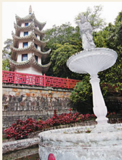
花園部分設有亭台樓閣，包括5層高寶塔及設有素白觀音像的水池。