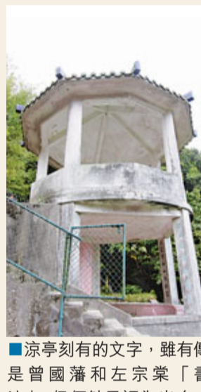
涼亭刻有的文字，雖有傳是曾國藩和左宗棠「書法」，但何勉君認為出自工匠臨摹之筆，將會考慮保留。