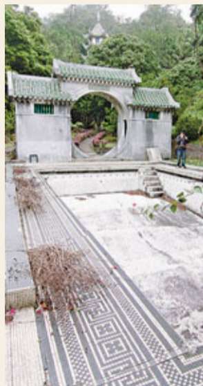
何勉君認為花園部分可以保留下來及對外開放。