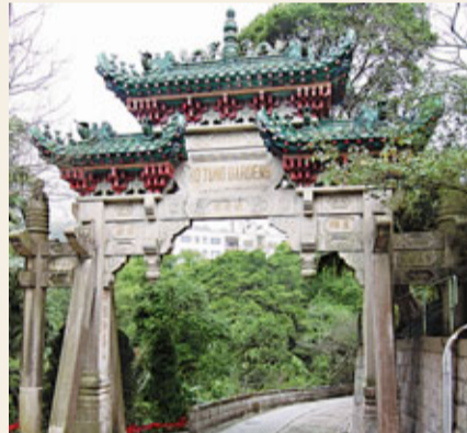
進入何東花園前，會經過寫有「曉覺樓」的牌樓。