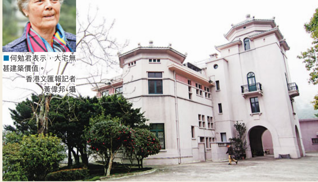
政府去年初把何東花園列作暫定古蹟，保護期限下周五屆滿。