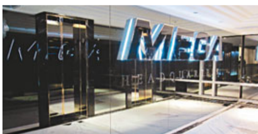
■涉案公司位於酒店內的辦公室入口。

司法部及FBI發表聲明，形容今次是美歷來「最大宗刑事侵權案件」，指控該網站多年來造成版權持有人超過5億美元(約38.8億港元)損失，從中獲利1.75億美元(約13.6億港元)。聲明指，雖然該網站總部設於香港，但因部分存放侵權檔案的伺服器位於弗吉尼亞州，故華府有權採取行動。