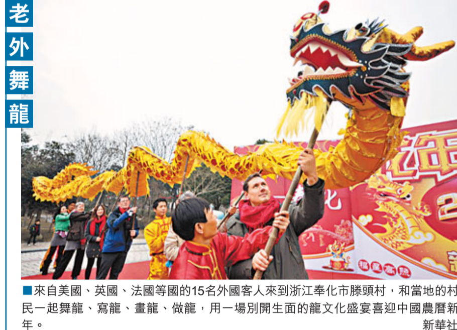
來自美國、英國、法國等國的15名外國客人來到浙江奉化市滕頭村，和當地的村民一起舞龍、寫龍、畫龍、做龍，用一場別開生面的龍文化盛宴歡迎中國農曆新年。

「國強必霸」有違中華傳統文化，背離世界發展潮流，絕不是中國的選擇。中國的和平發展對世界是機遇而不是挑戰，需要國際社會的理解和支持。」該官員還表示，中國致力於與美國發展相互尊重、互利的合作夥伴關係，願與美方加強對話、增進互信、擴大合作，共同推動中美關係在21世紀第二個十年健康穩定地向前發展。客觀理性判斷彼此戰略意圖和政策走向，不斷增進戰略互信，對中美雙方都有利。