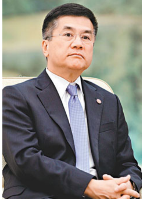
香港文匯報訊 針對美國駐華大使駱家輝(見圖)日前指「中國的發展意圖讓全世界擔心」等言論，中國外交部官員昨日接受《環球時報》訪問並作出回應，強調中國戰略意圖透明，「國強必霸」絕不是中國的選擇；中國的和平發展對世界是機遇而不是挑戰，需要國際社會的理解和支持。