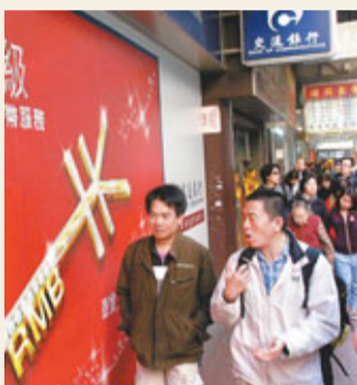
發改委將進一步簡化境內企業赴港發行人民幣債券的申請程序。圖為香港銀行推出人民幣服務。

去年，財政部會同科技部修訂國家科技計劃管理辦法，對課題承擔單位中企業的限制適當放寬，香港獨資和合資企業也可以申請課題，獲得經費支持。2012年將繼續落實相關政策，並會同科技部研究對外開放程度擴大情況下國家科技計劃管理相關問題。此外，積極支持國家重點實驗室建設，促進其與香港夥伴實驗室的交流合作。