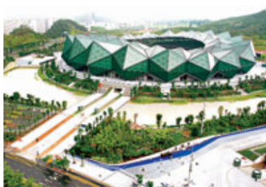
位於龍崗的大運中心(水晶石)。

大運會後，深圳民眾能盼來價格低廉、使用方便的公共運動場嗎？如果說「春蘭」這種超大型體育場運作昂貴，與滿足大眾公益體育相距甚遠，那麼位於龍崗的大運中心(水晶石)，或許可以實現體育場服務地方民眾的目的。