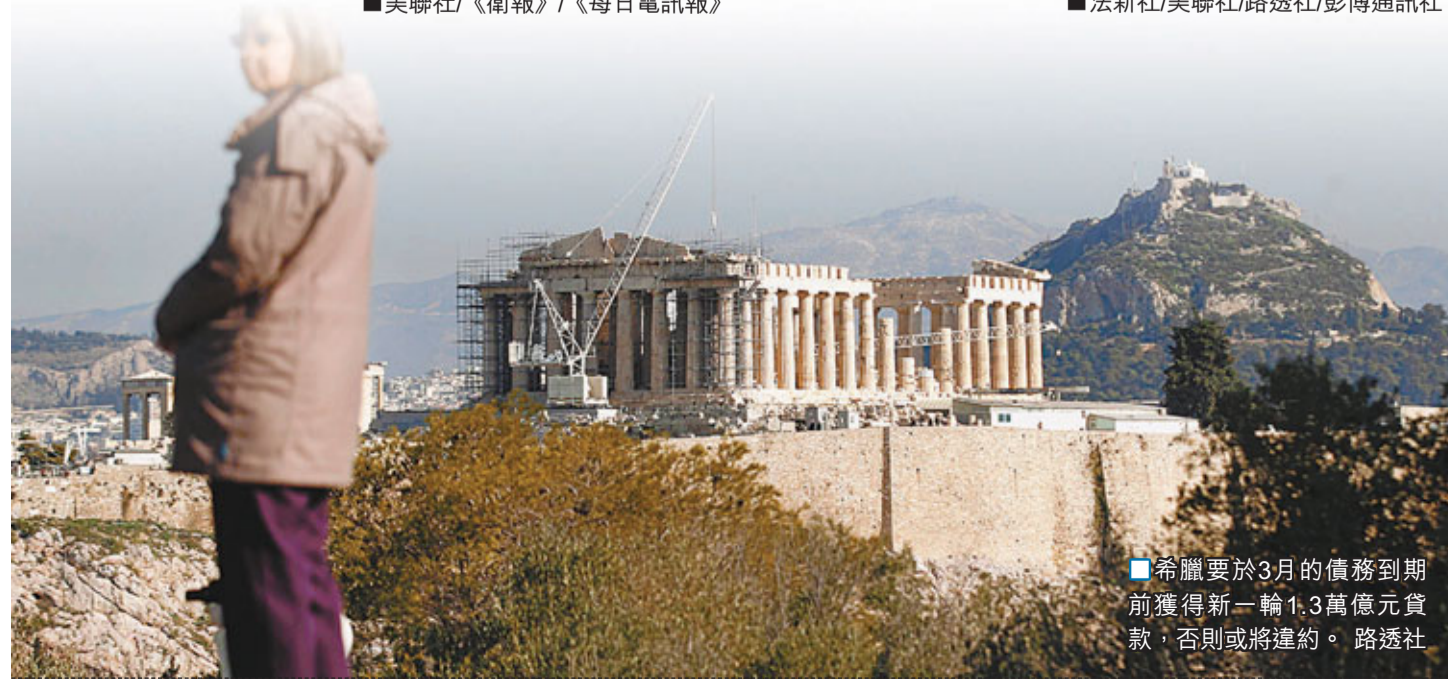
■希臘要於3月的債務到期前獲得新一輪1,3萬億元貸款，否則或將違約。