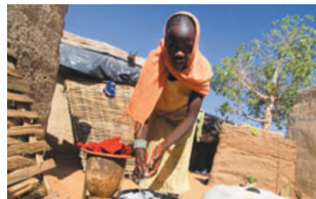
■蘇丹達富爾問題亦未解決，一名女孩在難民營打水洗衣服。

南蘇丹新聞部長本傑明表示，停產需一系列技術操作，最快要在一至兩個星期後才能全面實施。他又宣布，部長會議同意總統基爾於下周五，與蘇丹總統巴希爾會面。南蘇丹停產石油消息未對國際油價構