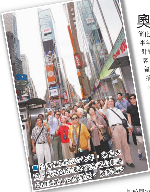
■白宮預期到2016年，來自大陸、巴西及印度的旅客將為美國經濟貢獻1,164億美元。資料圖片

奧巴馬前日簽署行政命令，下令國務院和國土安全部着手簡化及加快非移民簽證申請程序，半年內提交進度報告。新措施主要針對中國大陸和巴西等金磚國遊客，同時訂立具體目標，確保八成簽證申請人在遞交申請後3周內接受面談，大大節省申請所需時間和金錢。