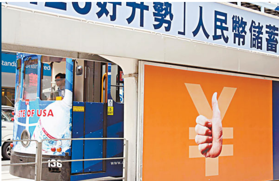
■央行有關負責人昨日表示, 國務院副總理李克強去年宣佈中央「挺港」36項措施以來, 香港人民幣離岸市場發展穩中有進。圖為香港街頭宣傳人民幣的廣告。