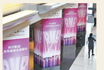
■香港銀行提供多元化人民幣服務。

香港文匯報訊 (記者 何凡 北京報道) 中國人民銀行有關負責人昨日指出, 香港發展人民幣離岸市場有天然、獨特的優勢。香港作為聲譽良好的自由市場和國際金融中心, 法制監管完備, 具有較成熟、先進的金融制度。同時, 香港作為國家的一部分, 與內地經濟、社會、政治聯繫緊密, 其監管機構和內地監管機構合作緊密。香港既可以是人民幣跨境使用的試驗窗口, 也可以作為「防火牆」。