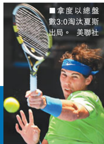
■拿度以總盤數3:0淘汰夏斯出局。

另外,拿度和費達拿昨日在男單次圈輕鬆過關,前者以總盤數3:0擊敗德國老將夏斯,躋身第3圈,而費達拿更因德國對手碧克因傷退賽,不戰而勝。