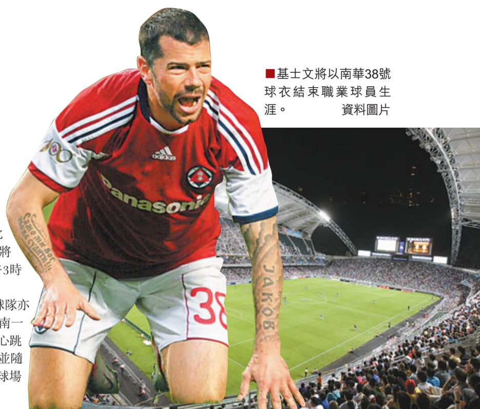
■基士文將以南華38號球衣結束職業球員生涯。

另外,參加亞超盃的中日韓球隊亦已確定抵港日期,韓國代表城南一和將於周五率先到港,而清水心跳和廣州富力則於年廿八抵港,並隨即出席賽前記者會和到香港大球場訓練。