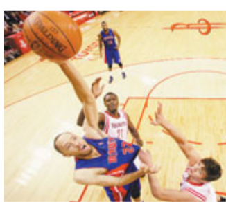
■活塞(藍衣)今季每場平均分在90分以下。

另外,聯盟周二宣布將於1月21日至28日期間舉辦「NBA龍年賀歲」春節慶祝活動,包括21場比賽轉播、專題節目及一系列NBA主題活動,當中巫師與勇士在1月23日和28日的比賽現場還將舉辦慶祝活動,球員將身穿特別設計的「NBA龍年賀歲」訓練服,還有其他春節主題的表演。