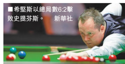
■希堅斯以總局數6:2擊敗史提芬斯。

座位),但能讓我放得開、更自在些。」在當晚結束的另一場較量中,澳洲名將羅拔臣以總局數6:3淘汰艾倫,8強將迎戰馬克威廉斯。