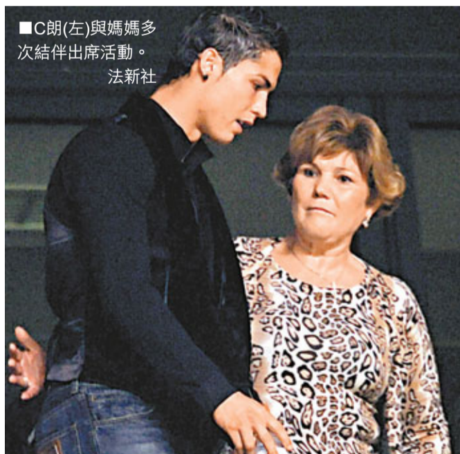
■C朗(左)與媽媽多次結伴出席活動。

葡萄牙《新人物》雜誌披露，西甲皇家馬德里的葡萄牙球星C·朗拿度(C朗)為了跟女友伊妮娜與兒子的生活能有獨立性，去年底已要求媽媽搬離自己的豪宅。有指C朗的母親十分掛念一直由自己照顧的孫兒，有時甚至掛得哭出來。不過事實上，C朗早已為母親找到住處，那還是一間豪華別墅。