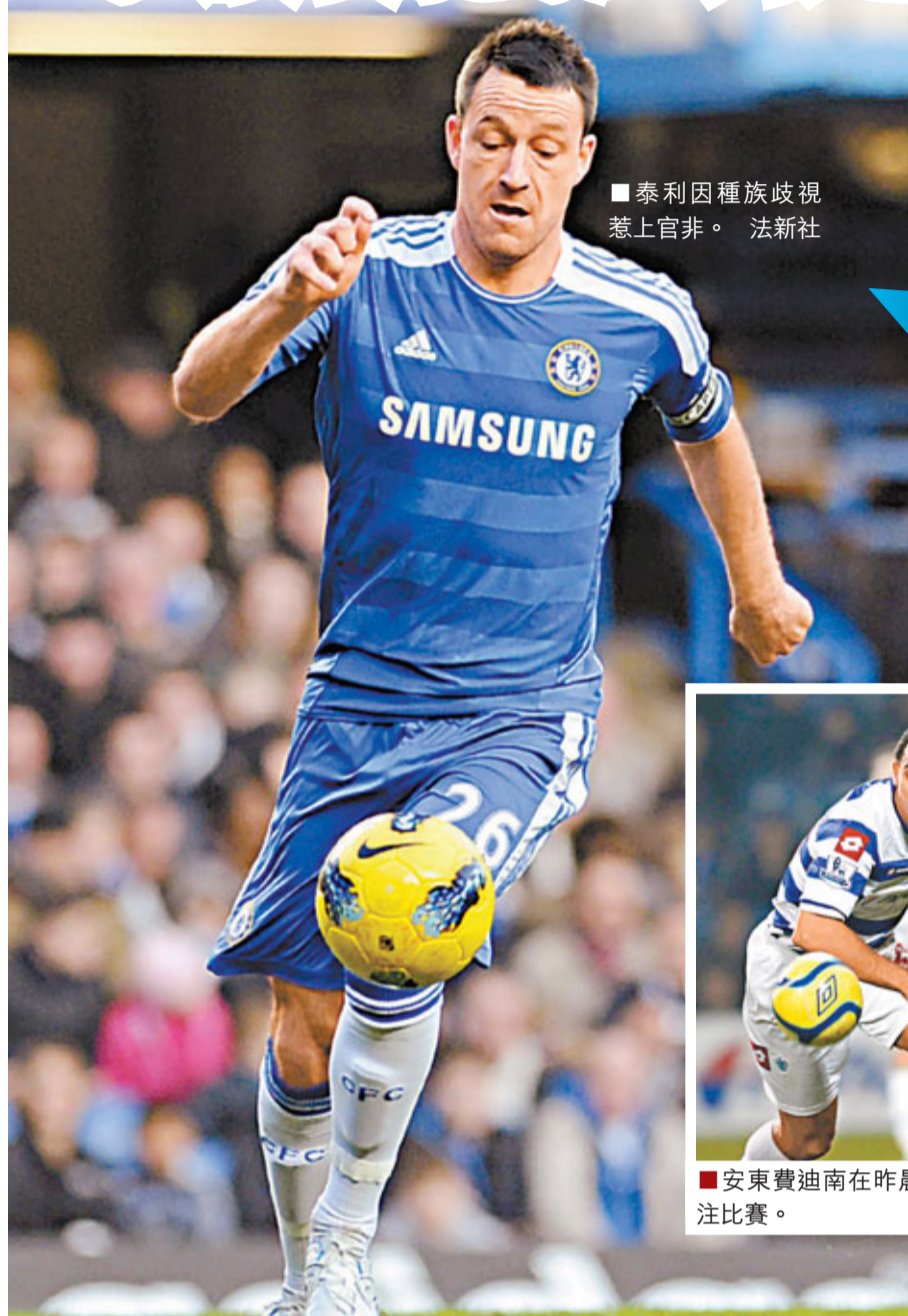
■泰利因種族歧視惹上官非。