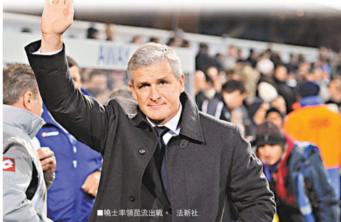
■曉士率領昆流出戰。

泰利在去年10月對陣昆流一戰中涉嫌曾以種族性詞彙侮辱安東，上月受到皇家檢察署的指控，需於2月1日到西倫敦法院出庭應訊，若罪成除了會面臨罰款2500英鎊(約3萬港元)外，亦恐會再失去英格蘭國足的隊長臂章。站在風口浪尖的泰利堅定否認有關指控，並聲稱要竭力為自己討回公道，車仔也發表聲明支持這位隊長。 ■香港文匯報記者 梁志達